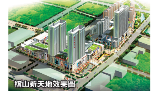
稽山新天地效果圖

二是「科技創業城」。一期工程計劃總投資10億元，佔地260畝，主要建設高新技術孵化中心、多層大型標準化廠房及配套綜合樓。重點吸引國內外科技研發機構、科技成果轉化項目入駐