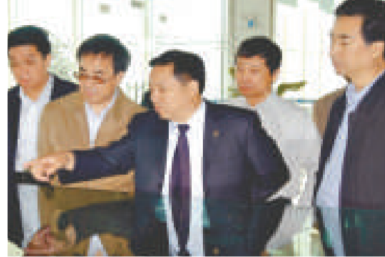
邯鄲市書記崔江水(右一)陪同河北省省長胡春華(左二)到鑫港國際商貿城調研