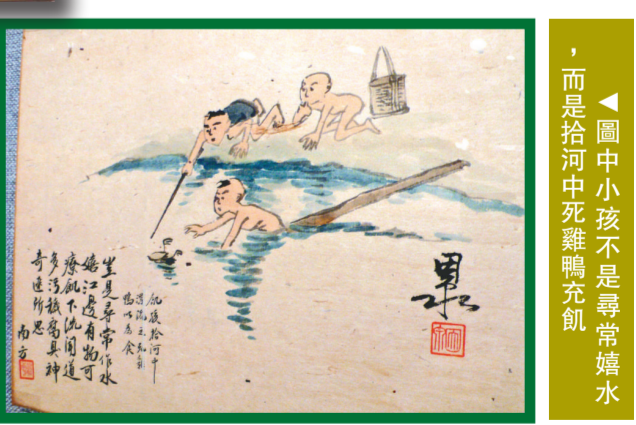
▲圖中小孩不是尋常嬉水，而是拾河中死雞鴨充飢