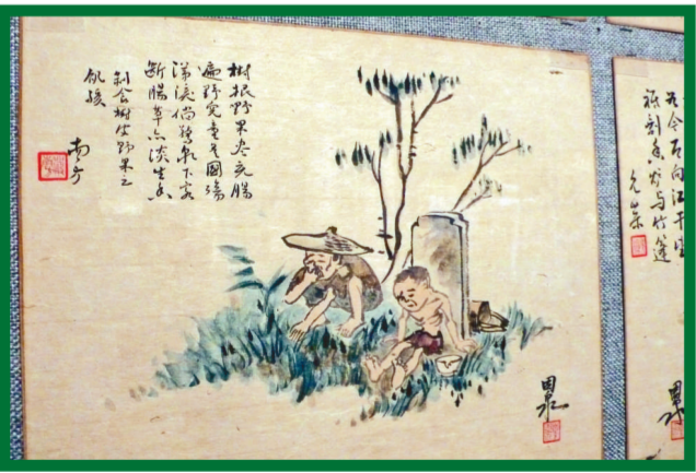
▲葉因泉的《抗戰流民圖》繪畫了人民在苦難中的生活，圖中人們樹根充飢

骨瘦如柴的小孩子，在河水旁不是嬉水，而是撈河中的死雞充飢；一名母親挨着餓，把只餘一碗湯食全給小孩吃；路旁有凍死骨，人們不再感到驚訝……。上世紀初漫畫家葉因泉，於三十至五十年代戰亂時期繪畫了一系列令人震撼的《抗戰流民圖》，把戰爭爲民生帶來的真實苦況繪畫下來，當中不少令人痛心疾首的場面。