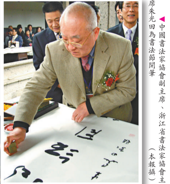
席朱光田爲書法節開筆，中國書法家協會副主席、浙江省書法家協會主席

華書院會員之最新力作。在杭州西湖美術館舉行的「越墨流韻」紹興書畫名家作品展」，共徵集到的七十五位書畫家百餘件作品，洋溢着濃濃的桑梓之情。書法節將持續到四月七日結束。