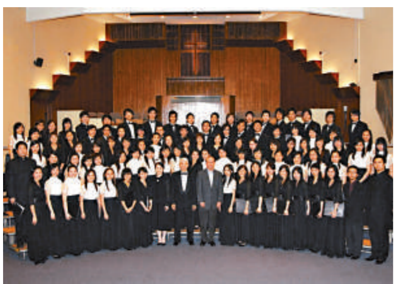
香港浸會大學合唱團和香港浸會大學女聲合唱團