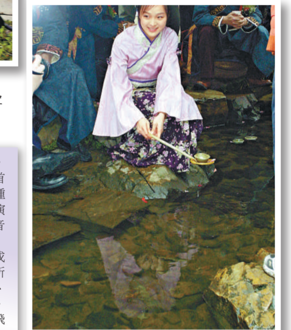
古裝美女正在溪邊爲書法家們舀起漂到書法家面前的酒盞