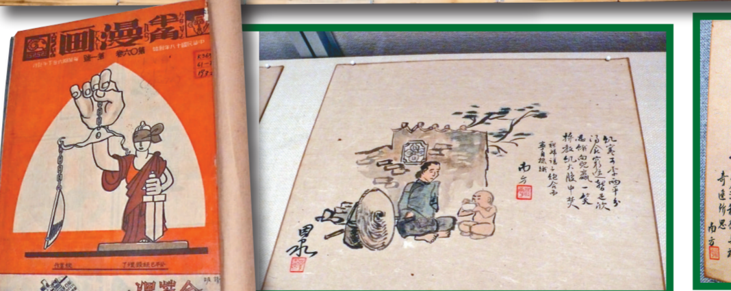
▲創寒下一婦女把一碗湯食給兒子吃，寧願自己挨餓 ▲《半角漫畫》諷刺時弊