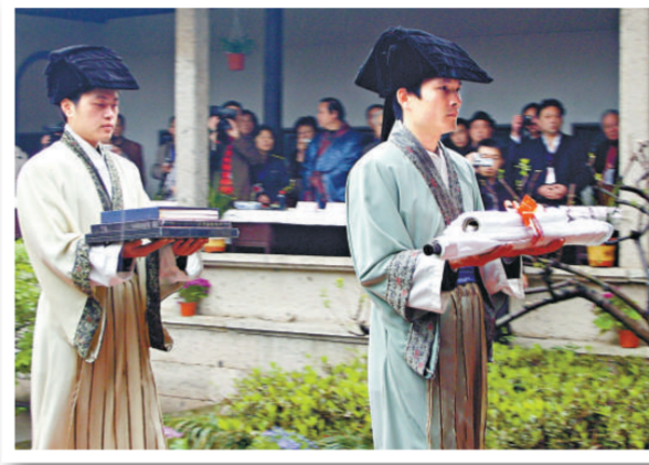
在蘭亭書法節開幕式上，書童穿晉時服裝，手捧書法作品，舉行作品敬獻儀式，此儀式屬晉聖儀式的一部分

除此之外，「紹興市政協慶祝建國60周年暨全國政協成立60周年書畫展」由三月二十九日至四月六日在蘭亭書法學院舉行，此次展出的九十餘幅作品，均係墨