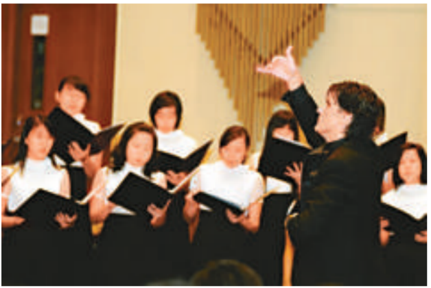
香港浸會大學女聲合唱團

【本報訊】兩個香港浸會大學合唱團將於四月五日（星期日）下午八時在該校善衡校園大學會堂舉行「春夜頌」音樂會，演唱各類悠揚悅耳的西方及世界傳統樂曲，公眾可免費出席。