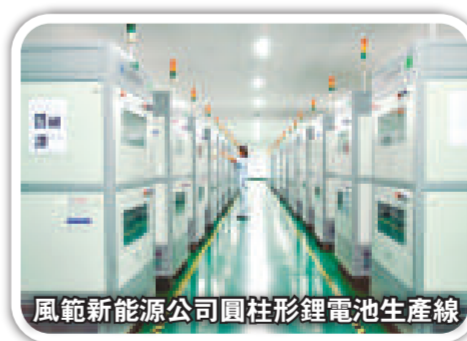
風範新能源公司圓柱形鋰電池生產線