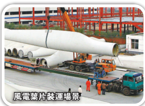
風電葉片裝運場景