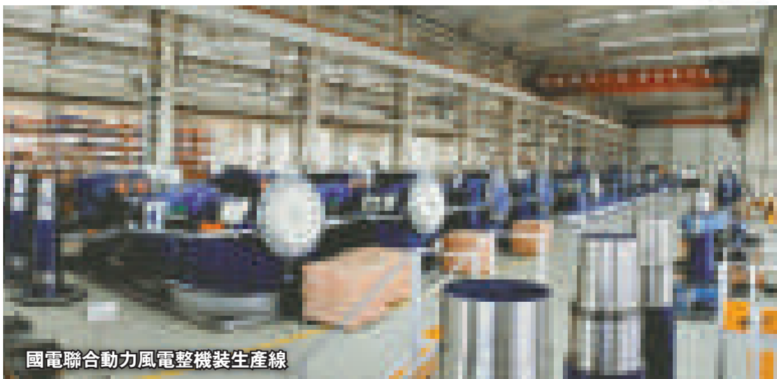
國電聯合動力風電整機裝生產線