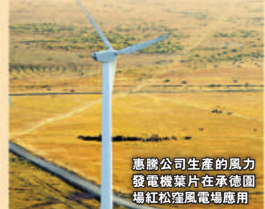
惠騰公司生產的風力發電機葉片在承德圍場紅松窪風電場應用

儲能領域，以風帆股份為龍頭，在傳統蓄電池和新型鋰電池製造方面保持領先優勢。 隨着「中國電谷」新能源產業品牌的逐步確立，保定新能源正得到越來越多知名企業、戰略資本的認同。日本三菱、韓國曉星、法國液化空氣公司等世界500強企業先後投資保定新能源與能源設備產業；中國兵裝集團、國電集團等一批致力於新能源事業的大集團相繼加盟，並已啓動一批重大項目。國家開發銀行與保定市政府達成共建中國電谷合作協議，5.5億貸款已陸續投入，與美國、德國等金融投資機構形成良好的戰略合作關係。 2008年12月11日，保定出台《關於進一步加快高新區發展的意見》，將高新區共建設及託管面積擴大到130平方公里，同時充分下放市級經濟、社會管理權。