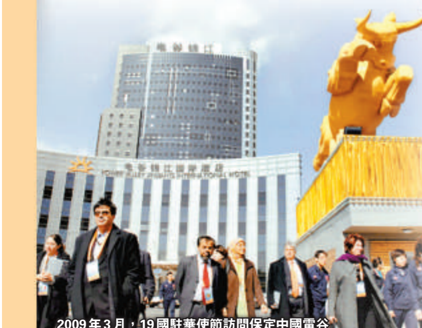
2009年3月，19國駐華使節訪問保定中國電谷