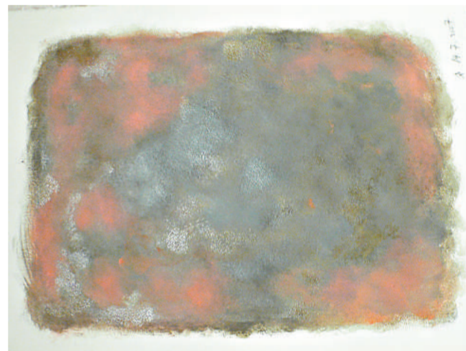
一方 系列二 (混合素材紙本)