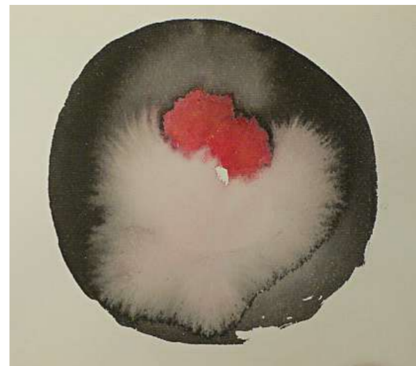
默 系列 (水彩紙本) 2007