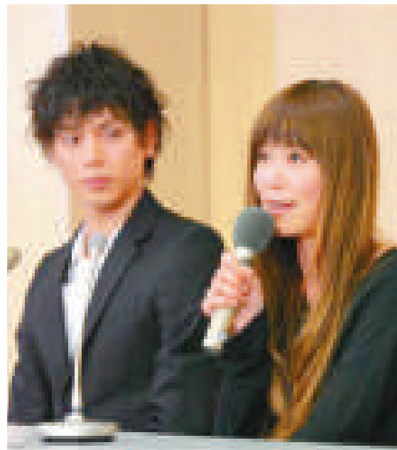
▲水嶋廣（左）和絢香於註冊後才向事務所報告，以「先斬後奏」的方式結婚

多引致，多發生於二十至四十歲女性身上，患者會有神經質、心悸、脾氣暴躁、失眠、消瘦、頸腫與眼球突出等多種症狀，甚至有不易受孕和流產的現象。此病可來自遺傳，也會因精神緊張或壓力等而引致，目前醫治的方法有三種，一為服藥，二為做手術切除，三是接受放射性治療，但此病不易斷尾，患者可能要終生服藥。絢香於樂壇可說是如日方中，就此引退十分可惜，希望她於丈夫的支持下能早日康復，再度活躍於樂壇。