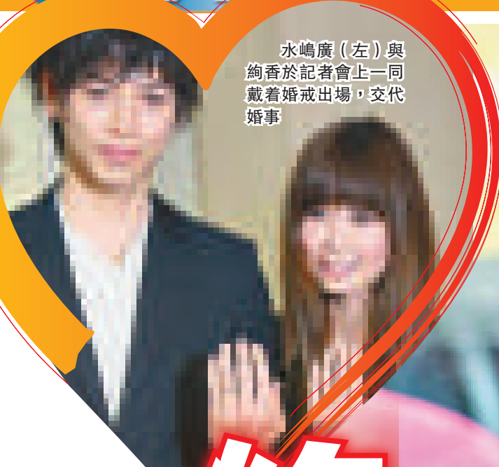
水嶋廣（左）與絢香於記者會上，兩人戴著婚戒，交相輝映。