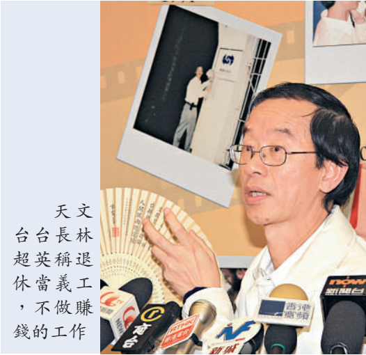
天文台台長林超英稱退休當義工，不做賺錢的工作