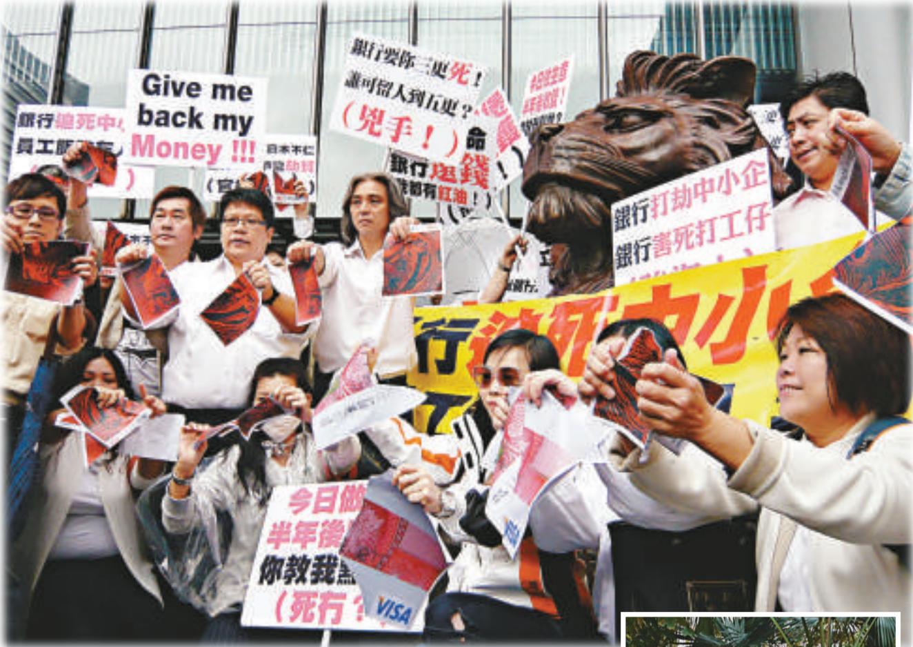
▲三百名美容業界從業員及僱主，遊行到滙豐銀行總部，抗議銀行單方面延長信用卡簽賬付款期

滙豐銀行發言人表示，將會視乎不同經濟環境因素、行業和商戶的個別財務情況，定期檢討與客戶的過數期。金融管理局發言人表示，銀行延長信用卡付款期是商業決定，金管局早於去年十月已發信呼籲銀行支持中小企信貸，在可行情況下個別評估中小企的財務狀況，靈活處理個案。銀行應與客戶緊密合作，消除客戶信貸問題。