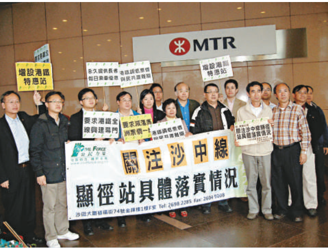
多名區議員昨向港鐵遞信，要求調整票價

由於廣東省「五一」不進行調休，各大旅行社提前進行各種跨省、廣東省內及港澳遊的中短途線路「甩賣」促銷，希望通過吸引更多遊客出遊填補部分出境遊線路的採購損失，有望帶動整個四月赴港遊熱潮。