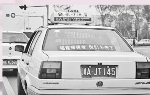
▲彭州許多出租車的擋風玻璃上貼有「福建援建者 你們辛苦了」等問候語