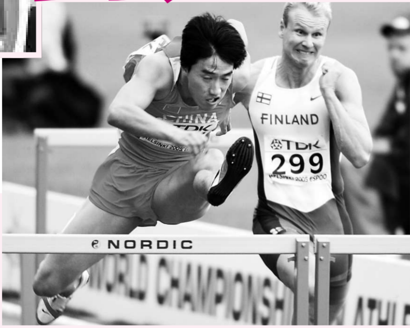
▲劉翔（左）將於九月再展雄風

【本報記者劉文傑上海七日電】2009年上海國際田徑黃金大獎賽今日在上海明天廣場舉行新賽季啓動儀式。這項賽事將於9月20日在上海體育場舉行。