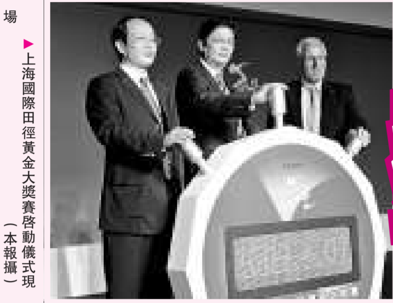
上海國際田徑黃金大獎賽啓動儀式現場