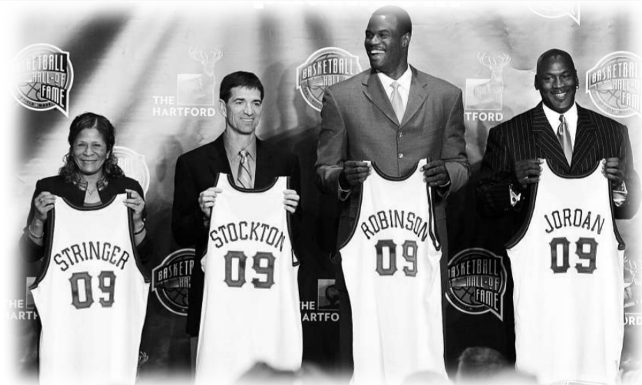
▲獲選進入名人堂的米高佐敦（右起）、大衛羅賓遜、史托頓及絲汀嘉，在儀式上笑逐顏開

【本報訊】綜合外電美國，底特律六日消息：「飛人」米高佐敦、大衛羅賓遜及史托頓3位90年代的NBA名將將在球員時代獲獎無數，他們的成就如今再獲肯定。3位名將周一獲選進入奈史密斯名人堂，與張伯倫、渣巴及奧拉祖雲等名宿並肩。