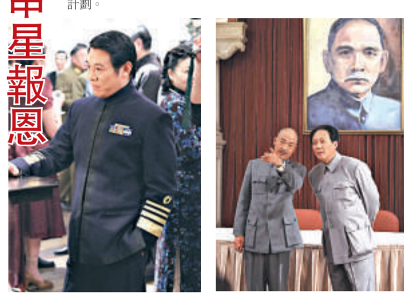
李連杰客串《建國大業》，只有三句對白（網上圖片） 張國立（左）與唐國強分別扮演蔣介石和毛澤東

不收酬勞 客串一天，三句台詞，這在李連杰的從影生涯裡都是第一次。而且，他演出這個角色並不收取任何報酬。他解釋說，自己這麼做的動機很簡單，因為中影一直對他的壹基金計劃非常支持，在每次活動的海報上都有體現。自己無法報恩，所以就以這樣一種方式來表示感激。而雖然拍戲不收取任何酬勞，但李連杰卻有自己的「小算盤」。他說，以前和中影的韓三平董事長商量過，希望中影每部電影在公映時，從每張電影票中拿出1毛錢來投入到壹基金。但後來中國電影發展迅速，這個比例似乎有點「過」。那麼李連杰希望可以退一步，每張電影票當中拿出一分錢來做慈善。他會藉這次拍戲的機會和韓總再次協商。 李連杰已經有1年半的時間沒有拍戲，時間都花在了壹基金計劃上。他表示，接下來會客串一些電影，但還沒有更多的拍戲計劃。