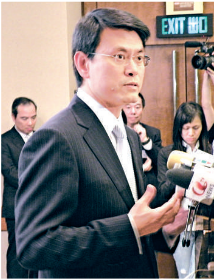
政府預期三年內將有超過一千六百個項目獲得資助，為機械、環境工程等相關業界帶來更多商機和就業機會。左圖為環境局局長邱騰華