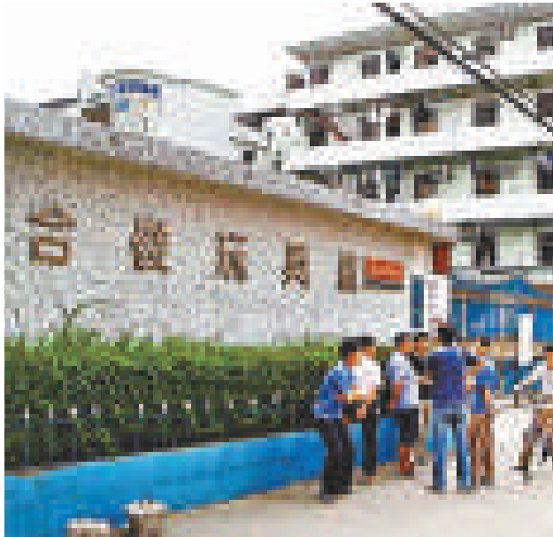
合俊倒閉原因是由於其自身經營方向而出現資金鏈斷裂問題

廣東省玩具協會有關人士表示，這是香港本土的玩具企業，還未包括在廣東設廠的港資企業。據不完全统计，參展的港資企業超過三十家，明顯比去年同期增加。