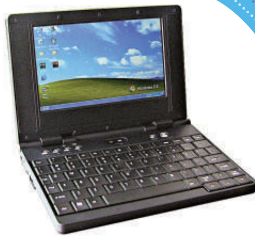
山寨廠筆記本電腦外型與品牌電腦相若

破解終端銷售的困局的重任也落在這些正規品牌公司身上。該人士分析，家電品牌加盟山寨本，在市場上將形成非常強大的競爭力。因為相對於一些電腦或手機的品牌而言，很多家電品牌都是普通老百姓耳熟能詳的名字，早已深入人心。貼上這種品牌