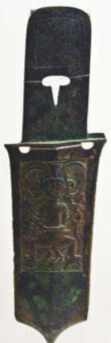
▲兵辟太歲銅戈，用兵之前預卜凶吉的法器