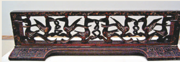
荆州天星觀2號墓出土的彩繪座屏