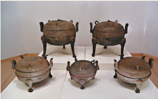
謝家橋一號漢墓出土的銅鼎，分高足和矮足兩種形制

楚簡以竹（木）簡為書寫材料，決定了楚簡的主要書寫動作——古人左手持簡、右手執筆而書，所以形成了以手腕為軸心的運動，使字形扁方且多呈左低右高之勢。這種字形的橫勢和倚側，頗具飛動翩跹的意趣，加上便捷、流利、輕鬆的書寫感，確立了