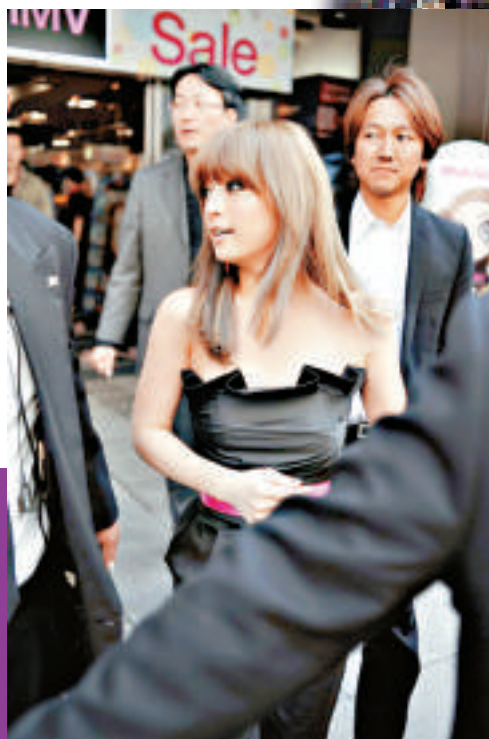
▲「步姐」出巡，令場面一度混亂 ▲「步姐」一出現，大批歌迷於街頭聚集