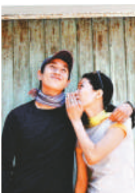
▲李善均宣布與拍拖六年的女友全慧真五月結婚 ▶李善均（左）和全慧真的結婚照崇尚自然