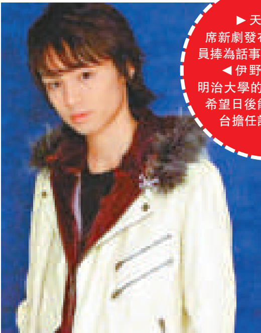
▶天海祐希出席新劇發布會，被眾演員捧為話事人 ▲伊野尾慧成功考入明治大學的建築系，表示希望日後能為組合的舞台擔任設計

富士電視台的新劇《Boss》，於前日舉行製作發布會，主演的天海祐希與竹野內豐等一同出席。天海首次扮演警官，更是刑警部的女波士，在劇中演她部下的溝端淳平說，天海在片廠中也是眾演員的指揮，天海聞言後即笑說自己不是那麼恐怖，又笑言在家中她的媽媽才是話事人，自己只會聽命行事。竹野內豐在劇中再演警察，他說以前做警察時，常常要皺起眉頭，今次的角色有點搞笑，所以表情也不用那麼嚴肅。