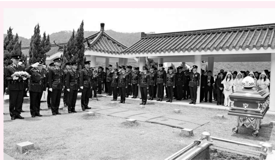
▲殉職警署警長陳家偉的靈柩昨日於浩園安葬