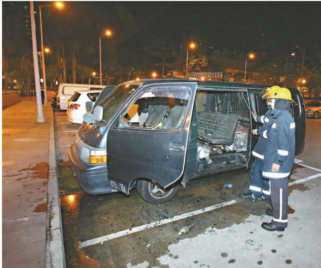
煙蒂未熄火燒車 一輛停泊上水龍琛路停車場的客貨車，昨日凌晨一時三十六分疑有人遺下未熄煙蒂釀火燒車，消防趕到開喉將火救熄，車廂內部分物品焚毀。

事緣於吳鎮宇在2004年底，斥資2038萬元，購入西貢君爵堡約3500呎3層獨立屋豪宅，並委託申索人進行裝修，整個工程淨開支為304.4萬元，加上15%利潤後，總數為約370萬元，但吳鎮宇只支付其中250萬元，尚欠120萬元。吳氏則指完工後發現地板不平、屋內櫃門關不上及漆油脫落，申索人的設計師亦沒有按他們指示設計，故向對方反申索60萬元，案件開審時則改為反申索41萬元。