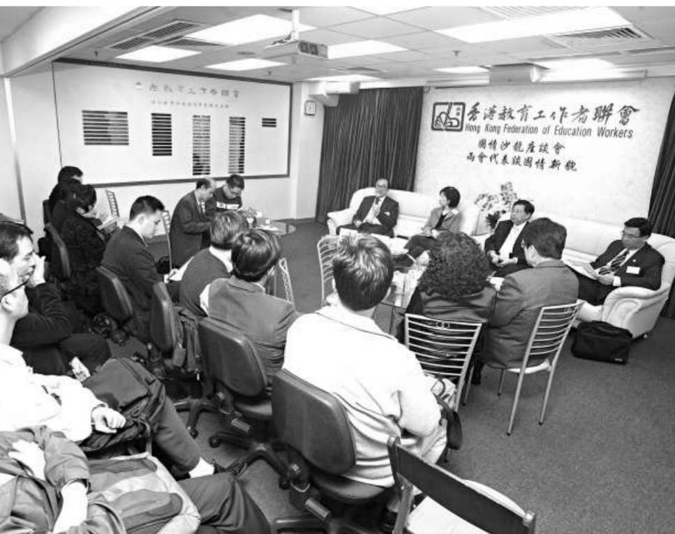
超過五十名教育界人士聽取兩會代表分享參與國是的體會（本報攝）