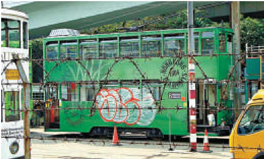
▲被人用噴漆塗鴉的電車

根據運輸及房屋局資料，去年共有十九宗巴士着火事件，當中成因以喉管滲漏最常見，佔意外宗數約三成，其次是電線短路，約佔五分之一，其他原因還有引擎故障、發電機故障、空調系統故障等。至於九巴，目前約二千部的巴士車隊，逾半數車齡達十年或以上。