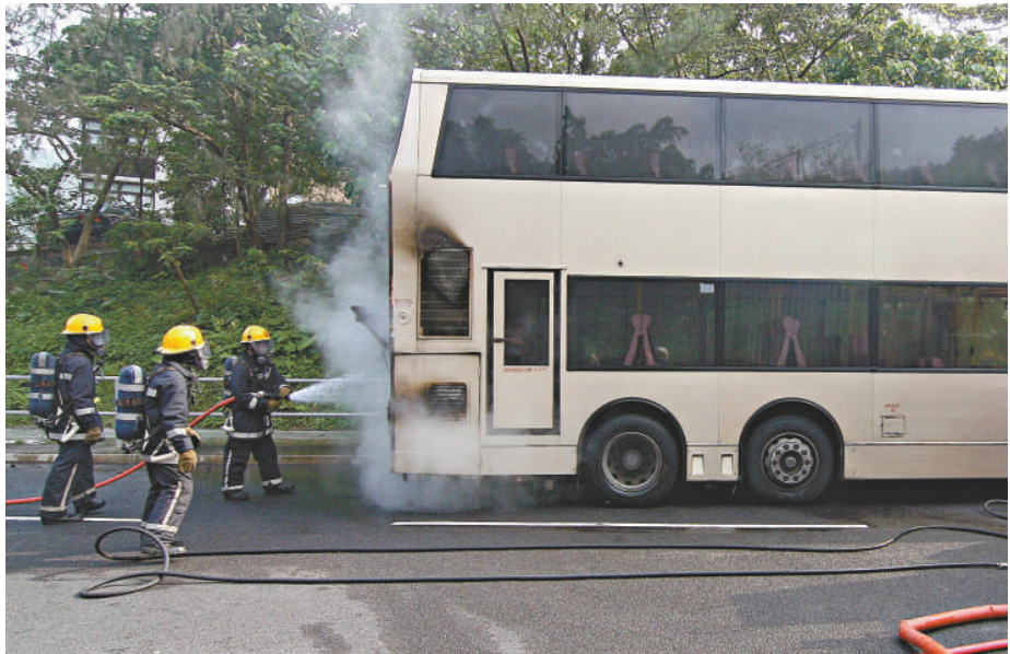
▲消防員在現場撲救

另外，灣仔謝斐道一間酒吧，昨日凌晨三時四十四分亦發生打鬥案，一名外籍顧客（三十六歲）在店內消遣時，因座位問題和酒吧一名南亞裔保安員（三十五歲）發生爭執，互相推撞後大打出手，警員接報到場調查，顧客聲稱頸痛，職員則報稱左前臂受傷，皆要由救護車送院檢查傷勢，事件暫時沒有人被捕。