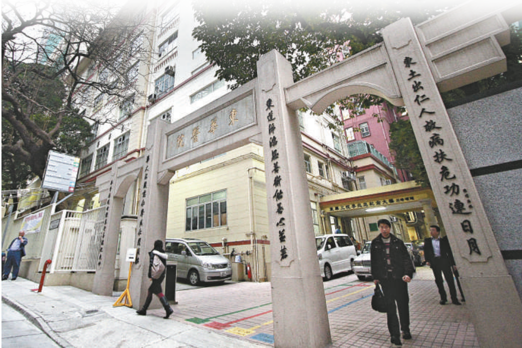
◀東華醫院已成立專責小組調查今次醫療事故 (資料圖片)

香港藥學會會長鄺耀深說，「苯巴比妥」為神經科藥物，三十毫克或六十毫克「苯巴比妥」均為正常劑量。他指出，若病人服用超出所需的劑量，將會導致呼吸過慢、血壓偏低、心跳減慢，嚴重會引致腎衰竭而死亡。