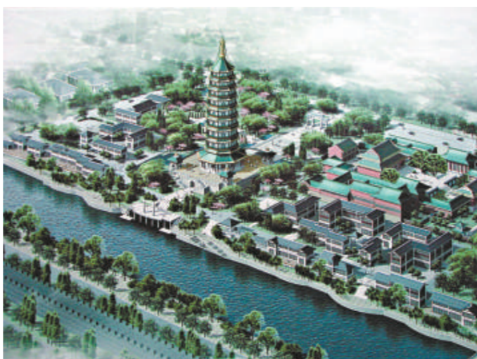
金陵大報恩寺復建效果圖（本報攝）

群與主殿遺址則以紀念建築方式保護起來，打造地宮第一遺址，此外還以佛教文化為主題，將佛文化與現代商業融為一體，重現長干廟宇繁華。去年，南京市決定斥資10億元重建金陵大報恩寺和被譽為「中世紀世界七大奇觀」的五彩琉璃塔，不過在大報恩寺遺址發掘出土可能藏有「佛頂真骨」的七寶阿育王塔而引起轟動之後，重建項目投資規模擴大至25億元，建設內容包括此次對外招商的一期工程以及綜合性商業為主的二期工程。此舉會引發巨大爭議，例如身為南京市政協委員的南京市佛教協會副會長、玄奘寺住持傳真法師就指出，重建金陵大報恩寺必須審慎規劃，絕對不能浪費納稅人的錢來再造一個「假文物」。