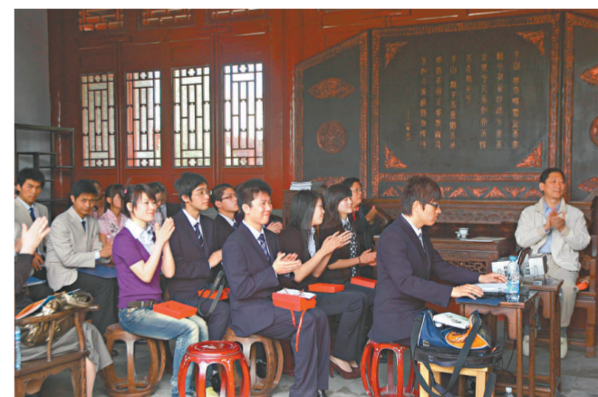
「經典回響·白鹿嵩陽文化之旅」書院主題演講活動現場