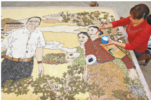
溫家寶總理兩度探望的四川大地震極重災區青川縣黃坪鄉，村民用五穀雜糧製作大型黏貼畫「總理來到秦樹村」，藝術性再現他親臨秦樹村關心慰問鄉民的情景

這幅「總理來到秦樹村」的大型五穀雜糧黏貼畫到時將作為重點對象展出，激勵民衆自力更生、用雙手建設出災後更美好的新家園。