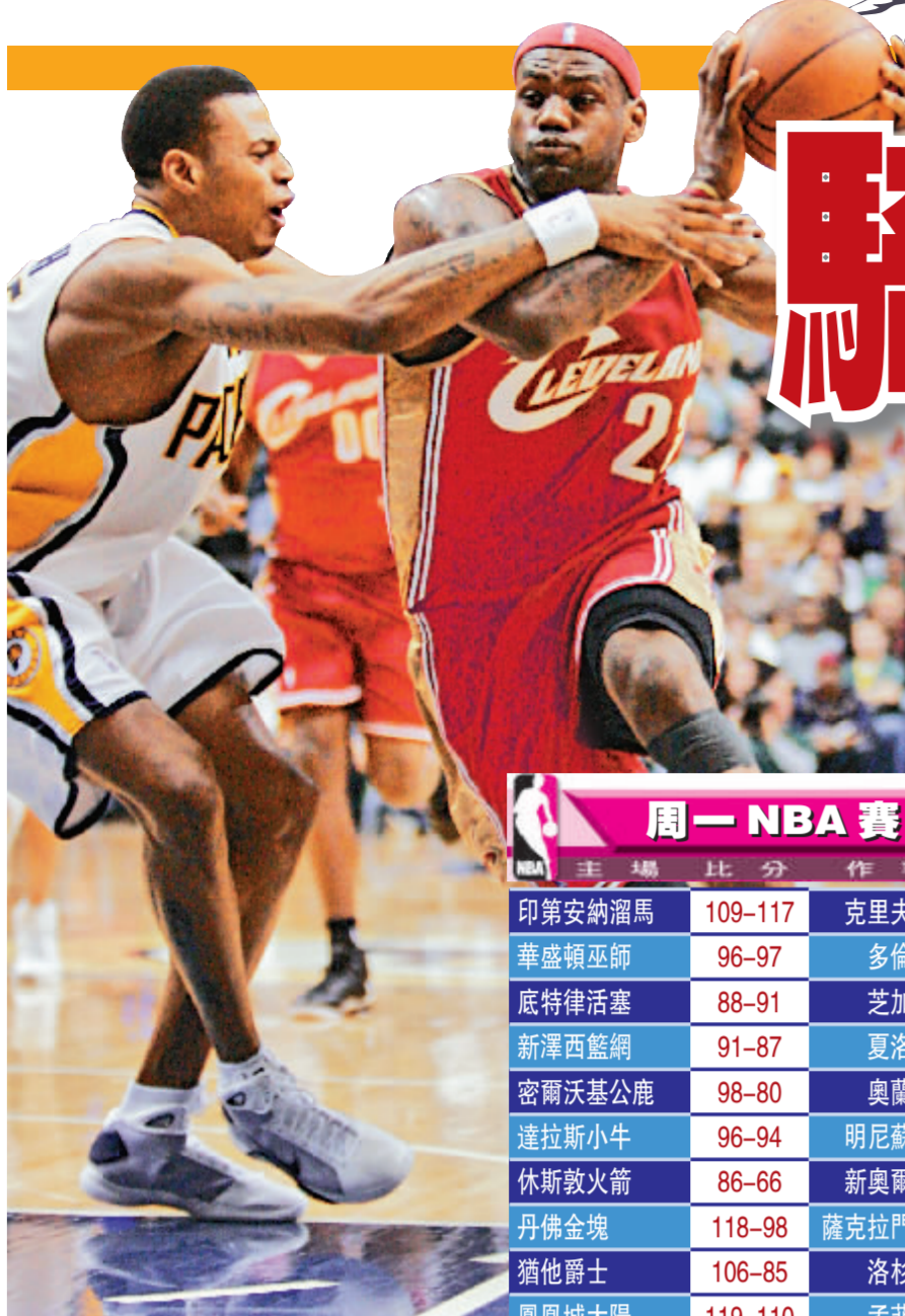
▲勒邦占士(右)遭到溜馬的班頓魯殊(左)侵犯,仍然奮勇上籃