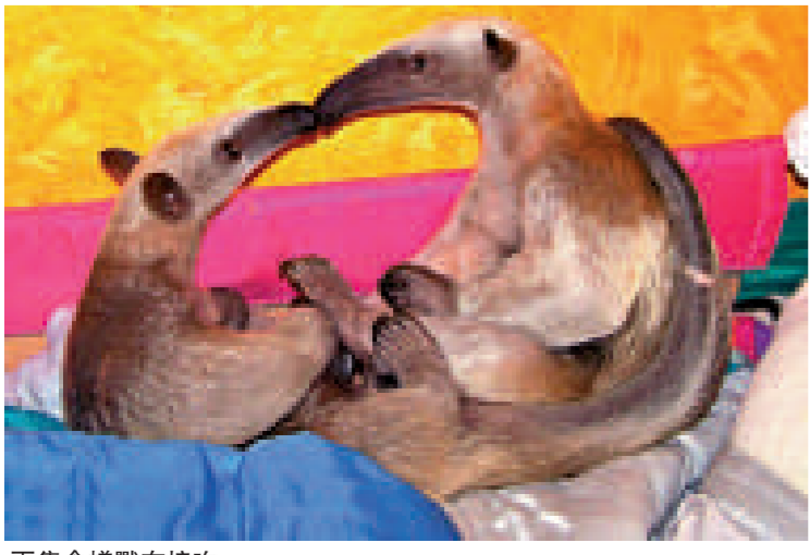
兩隻食蟻獸在接吻

食蟻獸主要棲於中美和南美的熱帶森林中。食蟻獸體型大小相差懸殊，小食蟻獸大似松鼠，不過三百五十克，而大食蟻獸則可重達二十五公斤。