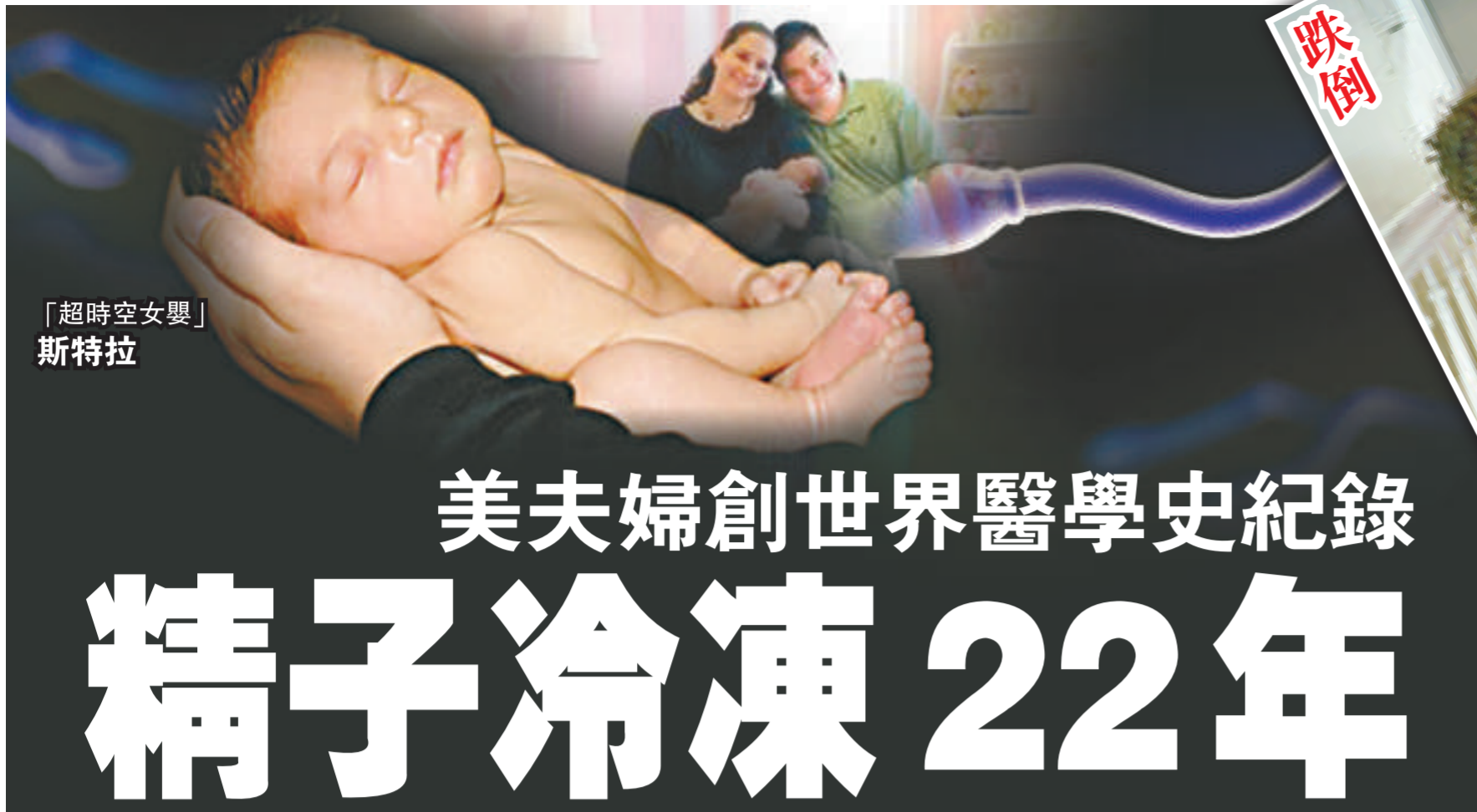
「超時空女嬰」斯特拉