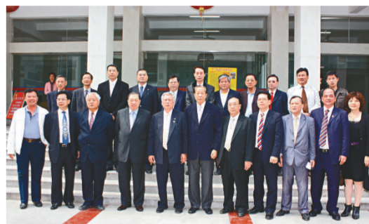
世界施氏宗親謁祖團匯聚眾多社團領袖，圖為部分成員合照