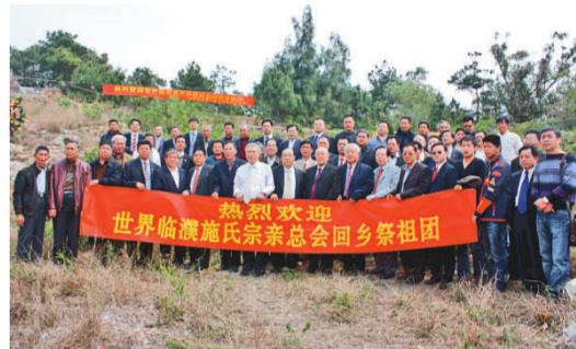
施氏宗親謁祖團拜祭灣江四世祖