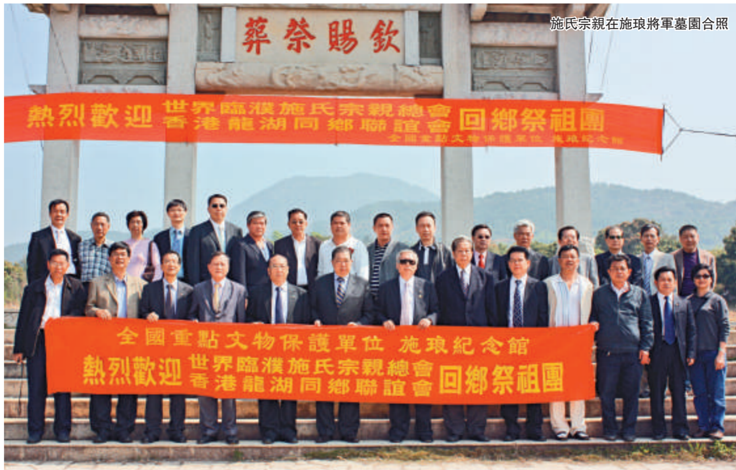
施氏宗親在施琅將軍墓園合照