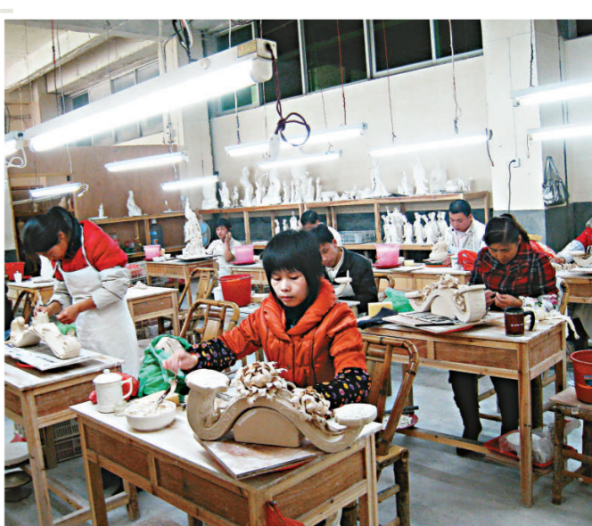
▲德化陶瓷企業有一千八百多家，陶瓷產值便達七十億元