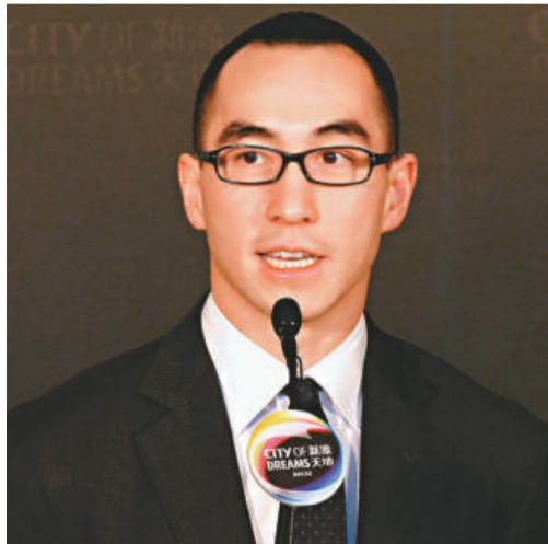
新濠博亞娛樂聯席主席及行政總裁何鴻燊宣佈新濠天地第一期於六月投入服務