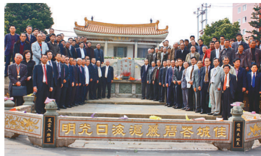
施氏宗親拜祭錢江始祖後合照