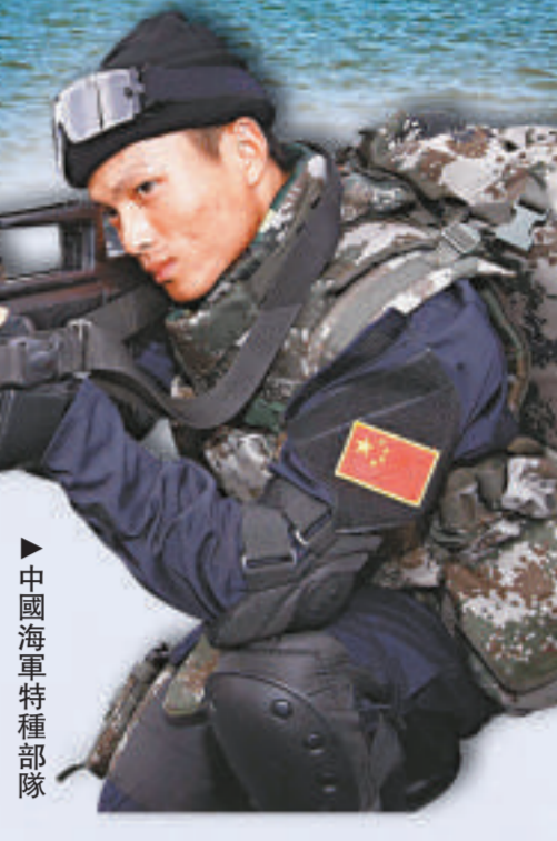
▶中國海軍特種部隊