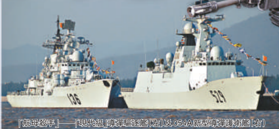
「航母殺手」——「現代級」導彈驅逐艦(左)及054A新型導彈護衛艦(右)

近年引起外界廣泛關注的中國海軍艦艇還包括具有隱形特徵、藍色迷彩塗裝的穿浪雙體022型導彈快艇。據美國「環球戰略網」報道，該艇實現高度自動化，除配備30毫米6管隱身速射艦炮外，還裝備了4枚鷹擊系列反艦導彈和誘餌發射裝置。此外，中國海軍第一種具備艦艇夜間航行補給能力、赴索馬里海域執行護航任務的福池級遠洋補給艦、滿載排水量達17600噸的071型兩棲攻擊艦「崑崙山」號，以及配有數百張病床和先進醫療保障系統的620型萬噸級專用醫療艦也倍受矚目。