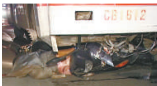
▲在南京被大巴撞後拖行的騎車男子已命喪黃泉

農林水產食品部說，該部上週對十七批中國製牛高湯進行檢測，在其中十三批驗出克倫特羅（瘦肉精，Clenbuterol）。