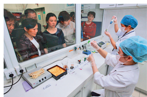
十三日，在合肥一超市設立的「食品安全快速檢測實驗室」外，消費者觀看檢測全過程。

目前，搜救隊伍仍在全力尋找失蹤者，進一步擴大搜索範圍，並通過廣播通告過往船舶注意失蹤人員，發現情況及時報告海事部門。