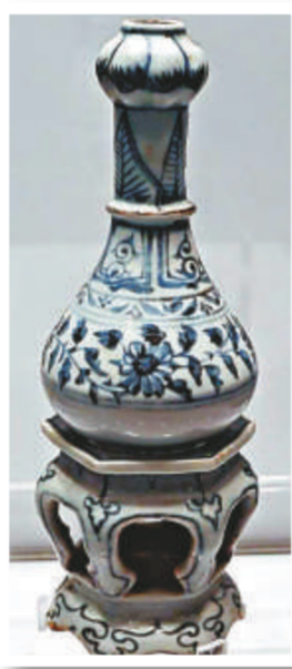
▲青花帶座纏枝菊蒜頭瓶