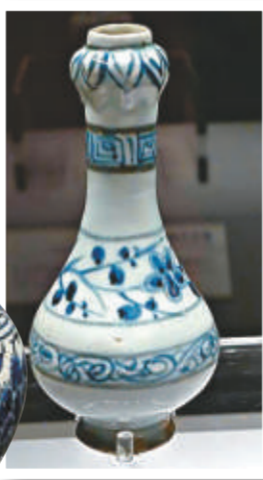
▲青花月梅紋蒜頭瓶