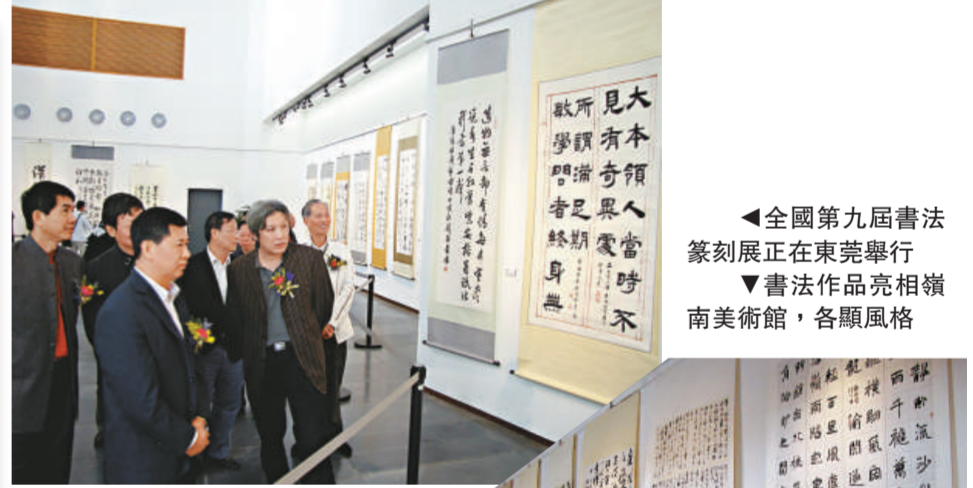
▲全國第九屆書法篆刻展正在東莞舉行 ▼書法作品亮相嶺南美術館，各顯風格

由中國書法家協會、廣東省委宣傳部主辦的全國第九屆書法篆刻展正在東莞嶺南美術館舉行，共展出近五百幅包括入展和獲獎作品，此次展覽將展至四月二十日。