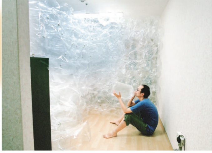
◀二〇〇六年作品《呼吸一間屋》的空氣》