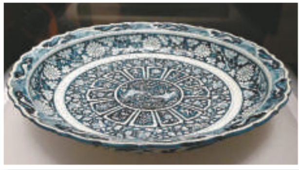
青花藍地白花雙鳳紋菱花口大盤（伊朗國家博物館藏）

一場名為「青花的記憶」的元代青花瓷文化展，正在北京首都博物館舉行。此次展覽由北京市文物局主辦，薈萃了國內外二十五家收藏機構的七十三件珍貴元代青花瓷器。該展覽的推出，旨在加強有關元青花瓷方面的研究、交流與合作，彰顯中華傳統歷史文化之魅力。