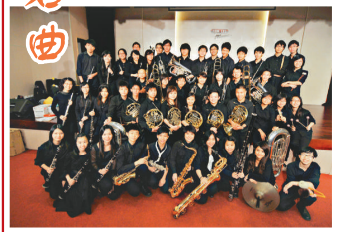
香港新青年管樂團將為樂迷演奏多首銅管樂曲

「通利香港新青年管樂團周年音樂會2009」將於五月一日（星期五）晚上七時三十分在沙田大會堂演奏廳舉行，門票現於城市電腦售票網公開發售。