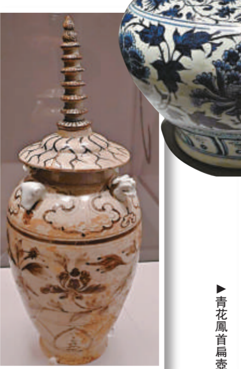
▶青花纏枝牡丹紋罐