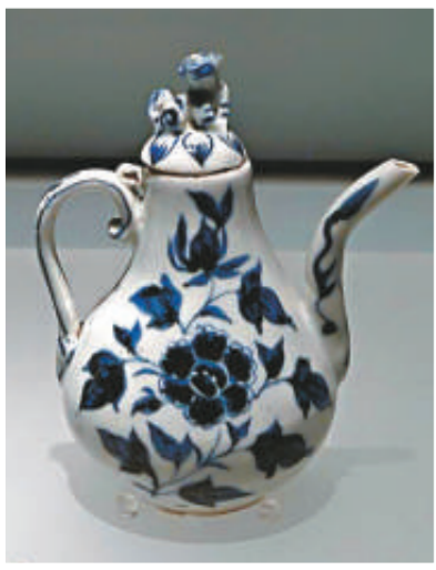
◀青花折枝牡丹紋梨形執壺 ▶青花牡丹紋塔式蓋瓶