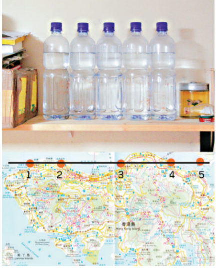
▶白雙全二〇〇四年作品《擺放在家中的海平線》，五樽在維港收集的海水形成一道水平線