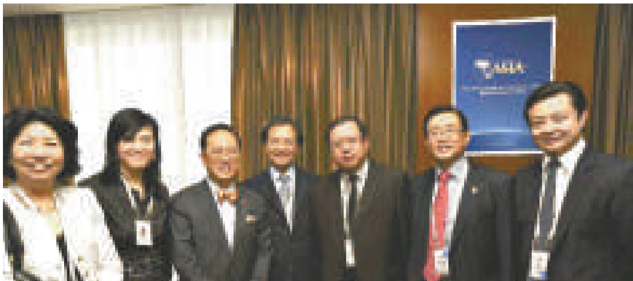
▲曾蔭權（左三）與出席論壇的香港商界代表合照

「博覽亞洲論壇年會」昨日在海南召開，主題是「經濟危機同亞洲挑戰與展望」。曾蔭權與夫人曾鮑笑薇等一行六人昨日下午約一時四十分抵達海口，在美蘭國際機場作約三分鐘停留後，即乘專車直赴博覽亞洲論壇年會會場，行程緊湊。曾蔭權傍晚主持由特區政府主辦的酒會，接待出席論壇的香港商界代表，包括中華總商會榮譽會長霍震寰、貿發局主席蘇澤光等四十人。出席論壇的國務院總理溫家寶，今日