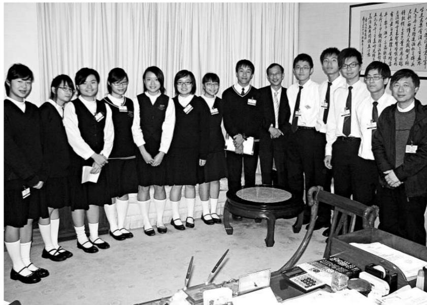
聖母無玷聖心書院的學生與立法會主席曾鈺成在主席辦公室拍照留念