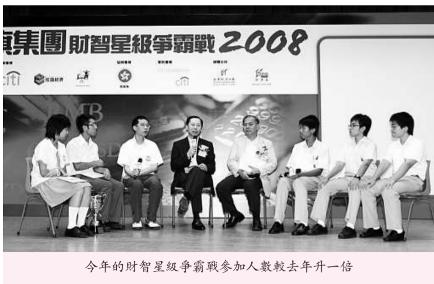
今年的財智星級爭霸戰參加人數較去年升一倍

【本報訊】「財智星級爭霸戰二〇〇九」將於今日展開，來自一百五十三間中學超過四千五百名學生報名參加，較去年的參加人數增加一倍。除了研討會及模擬網上股票買賣活動外，今年的爭霸戰還新增網上工作坊活動及互動資訊渠道。主辦機構花旗集團香港區行政長官景曼表示，在經濟前景不明朗之時，市場對理財教育的需求與日俱增。