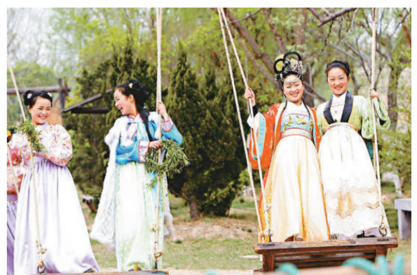
▲清明上河園再現「清明贈柳」民俗