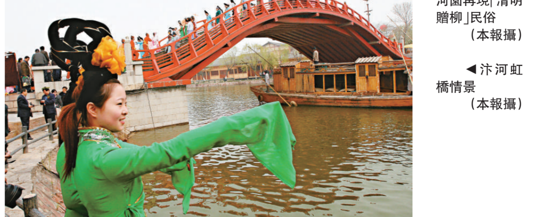
◀汴河虹橋情景（本報攝）