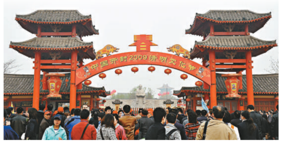
◀清明文化節在河南開封清明上河園舉行

《美》劇有一半演員是第一或第二次參與香港話劇團的演出，他們的年齡和外型跟角色很接近，又花了心血去令自己的身心狀態跟角色的生活背景、性格和心路歷程融成一體，使角色於台上活靈活現。有了這班出色的新演員，證明香港話劇團是一個充滿活力和希望的劇團。