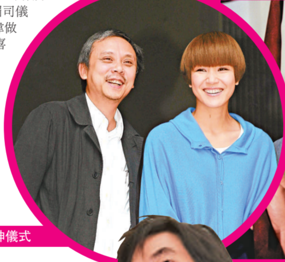
陳嘉上(左)和阿詩齊出席頒獎禮拜神儀式

謝安琪以歌手轉型演員的身份擔任頒獎禮司儀 (資料圖片) 發哥以工作繁忙而不能出席頒獎禮 (資料圖片) 金像獎力邀紅姑出席頒獎禮，但她婉拒了 (資料圖片)