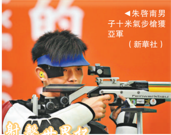
▲朱啟南男子十米氣步槍獲亞軍

【本報訊】據中新社北京十八日消息：2009年國際射擊聯合會世界盃北京站的比賽今天在奧運場館打響。在首日的男子十米氣步槍比賽中，匈牙利老将西迪以0.2環的微弱優勢奪得冠軍，中國隊雅典奧運會冠軍朱啟南通過加賽戰勝捷克選手哈曼獲得亞軍。