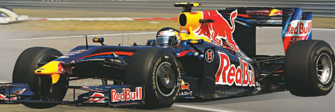
▶紅牛車隊維特爾以1分36秒184奪得桿位