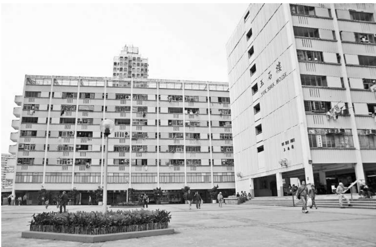
坪石邨首創「回憶閣」，展示屋邨近四十年的集體回憶，加上增建電梯、免費為每戶加裝晾衣架等改善工程，令坪石邨成為模範屋邨

坪石邨活化改善工程預計明年中展開，房署去年底預算，加建升降機工程耗資大約四千六百萬元，據了解，有關開支預算考慮增加一倍，達至九千萬元。