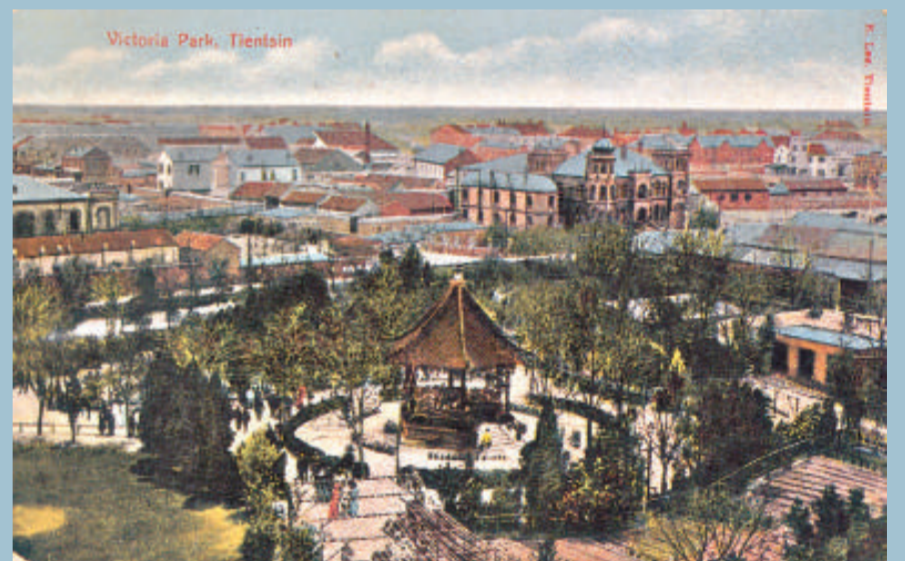
維多利亞公園鳥瞰

戈登堂。抗日戰爭勝利後曾為國民黨天津市政府。解放後，為天津市人民政府辦公樓，1976年地震中被破壞，後拆除在原址建成今天津市政府大樓。