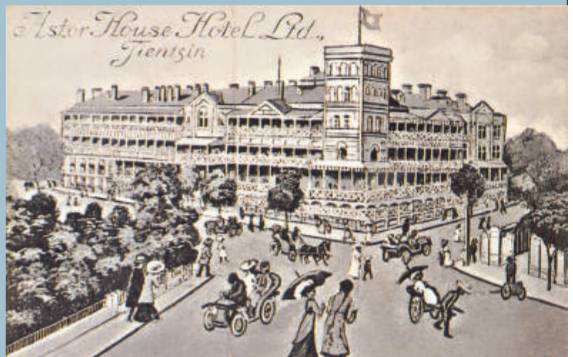
利順德飯店外景繪畫。

維多利亞路(今解放北路)。當年馬路兩側各國銀行林立，如：英國的滙豐、麥加利、美國的花旗，華俄合資的道勝，日本的橫濱正金等銀行，故又有「東方華爾街」之稱。