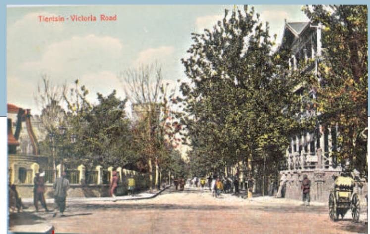
利順德飯店前景。飯店對面即維多利亞公園。

利順德飯店南端的塔樓。路上站一英籍印度警察。該明信片係1916年7月4日自天津寄出，貼帆船郵票，郵戳不清。