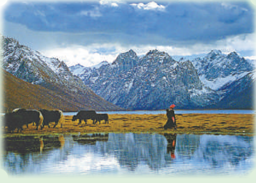
音樂會將在美麗的黃河岸邊舉行