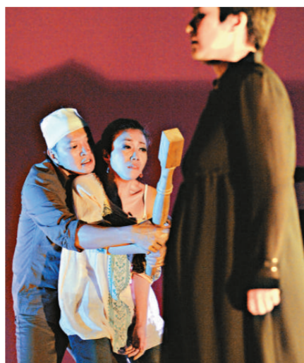
長久積壓的情緒，在《聖荷西謀殺案》中終於爆發，引發血案