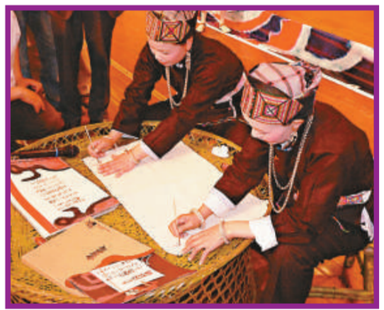
富寧縣壯族同胞在首發式上現場演繹《坡芽歌書》中民歌調