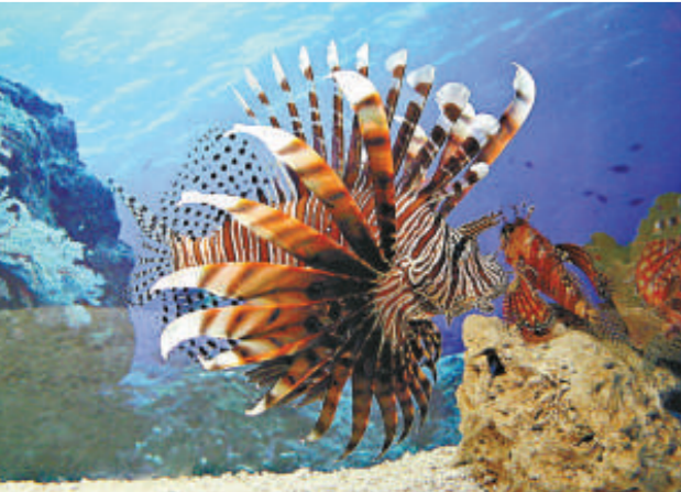
海洋裡的「毒皇后」獅子魚

【本報記者丁春麗、通訊員閻政濟南二十日電】為進行有毒水生生物海洋科普教育，青島海底世界將從「五一」開始舉辦獨家從國外引進的「有毒生物」主題展。八大毒物，匯聚海底，各自展現「毒門絕技」和「毒有魅力」。