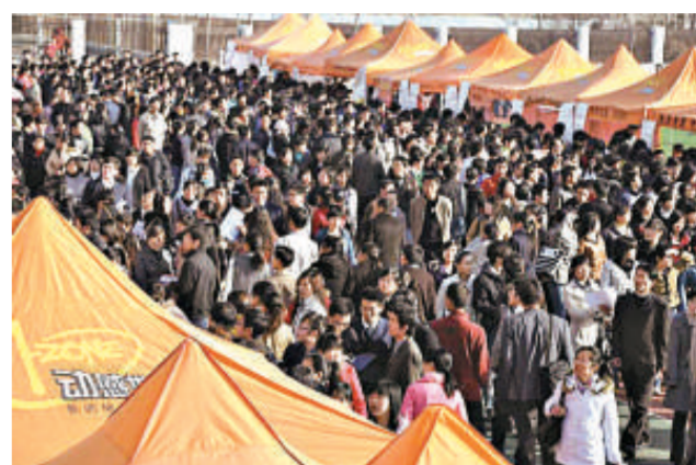
受金融危機影響，今年招工的大學生擠爆招聘會