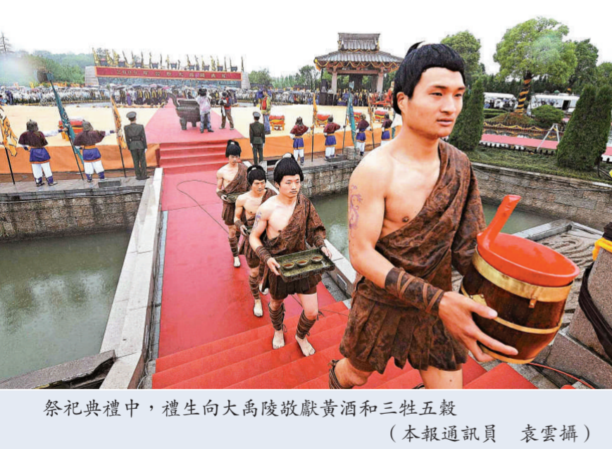
祭祀典禮中，禮生向大禹陵敬獻黃酒和三牲五穀

【本報記者費嘉杭州二十日電】「北祭黃帝陵，南祭大禹陵」，今天浙江紹興大禹陵公祭之日。