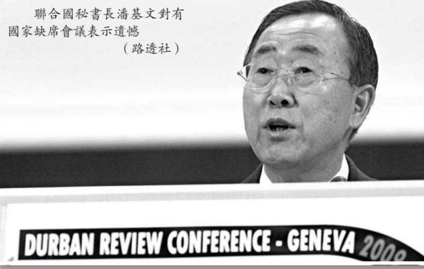
聯合國秘書長潘基文對有國家缺席會議表示遺憾

聯合國秘書長潘基文在開幕式致詞說，在反對種族主義的鬥爭中，我們應該向前看，而不要看存在分歧、分裂的過去。他對某些國家缺席德班會議大會「深表遺憾」，希望這些國家的缺席是「暫時的」。