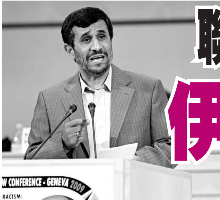
伊朗總統內賈德在聯合國反種族主義大會上演講大罵以色列