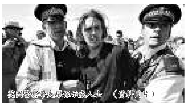
英國警察帶走環保示威人士 (資料圖片)

事件十九日受到環保人士、國會議員和民權組織的抨擊。一個民權組織的負責人譴責這是嚴重的濫權行為。她說：「政府把警員變成了大企業的私家保安員。警方的作用應該是保護潛在受害者和方便人民行使示威權利。」