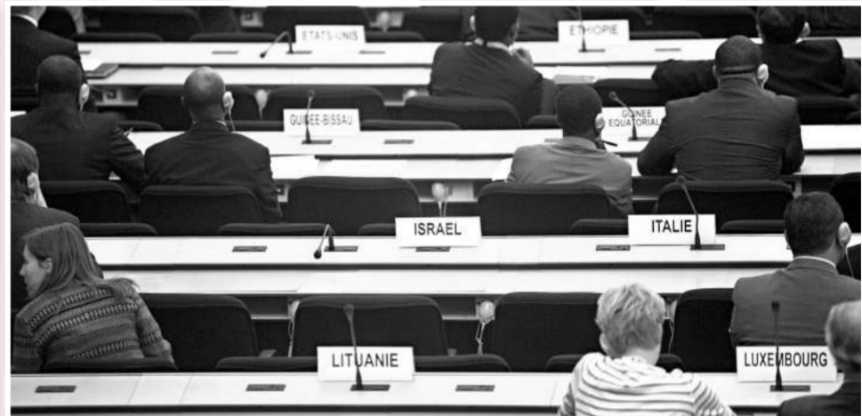
以色列拒絕出席大會