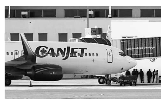
牙買加士兵二十日站在被劫持的加拿大客機旁

所有乘客都是加拿大人。飛機是從加拿大新斯科舍省哈利法克斯飛抵牙買加的，並準備飛往古巴聖克拉拉，然後返回加拿大。