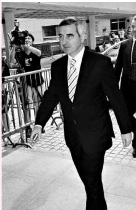
電盈董事總經理艾維朗抵達高等法院