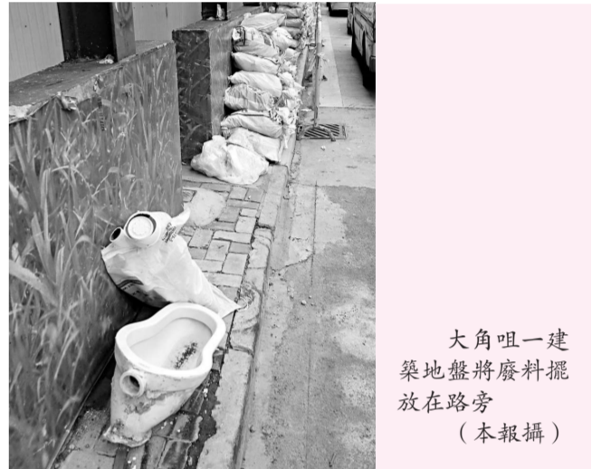
大角咀一建築地盤將廢料擺放在路旁

多名出席的議員質疑，有關計劃如自願執行，不會有成效，要求當局強制執行紀錄制度。政府代表回應說，以自願形式實行，是因為強制執行將會涉及大量人手，小型工程承辦商未必能夠承擔，而自願形式較易獲得業界支持，下一步才研究強制方法。