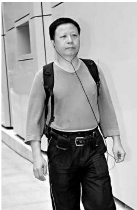
上訴庭昨審理電盈私有化，圖為一名小股東抵達法院情形

另外，電盈代表呈交於二月初四日私有化會議的投票紀錄，指當日有六百六十七名小股東出席，有五百三十一人投票，有一百三十六人沒有投票。