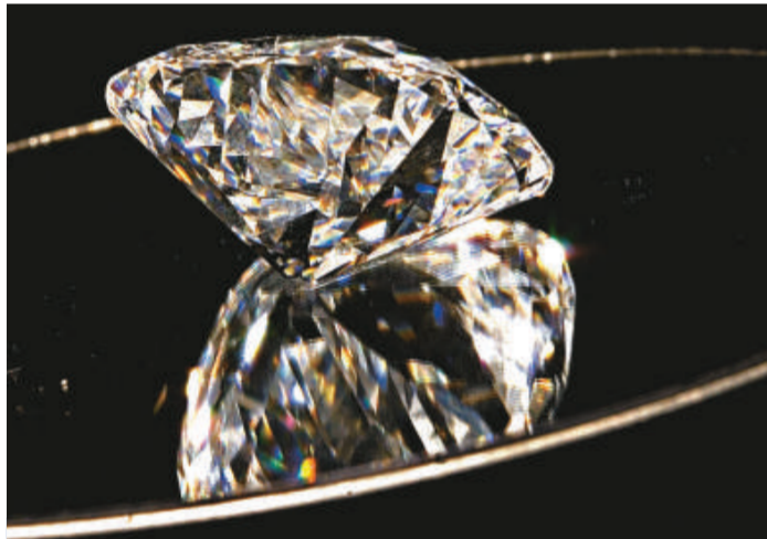
市場對珠寶的需求放緩，鑽石生產商續削減鑽石出口

受到美元反彈的刺激，紐約期油價格昨日一度下跌4%或2.03美元，跌至48.3美元，不過，由於全球股市轉跌，黃金再成資金避難所，現貨金價在倫敦一定反彈1.55美元，或0.2%，至870.35美元。