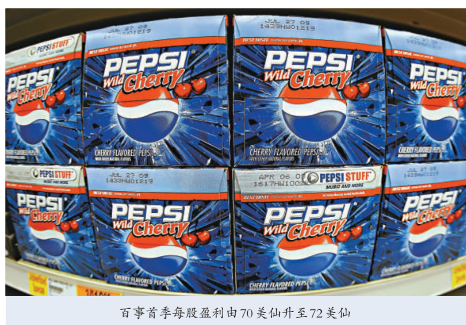
百事首季每股盈利由70美仙升至72美仙

百事首季每股盈利由70美仙升至72美仙，該公司重申全年的淨銷售可以錄得中單位數至高單位數的增長，而每股核心盈利亦可錄得上述的增長。