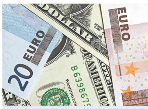
歐央行官員就如何解決經濟衰退而呈意見分歧，拖累歐元匯價急跌