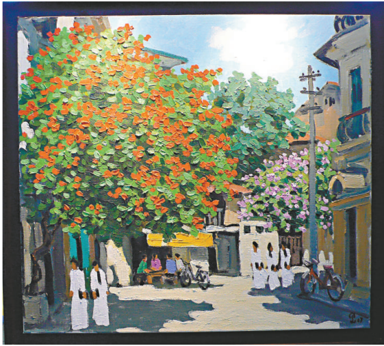
▲ Pham Luan 作品《High noon》