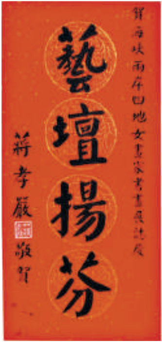
蔣孝嚴為畫展題詞：藝壇揚芬

【本報訊】為弘揚中華文化，為促進兩岸四地文化藝術交流，增進兩岸書畫家之間的情誼，共同促進書畫藝術繁榮與發展，為促進兩岸和平穩定發展。為紀念改革開放三十周年，為紀念寧波美術館新館建成四周年。由寧波市文聯、國際青年文化交流中心（香港）、香港海峽兩岸文化藝術交流協會主辦，寧波美術館承辦的寧波、香港、澳門、台灣「兩岸四地女書畫家作品展」於本月二十二日至五月三日在美麗的海濱城市寧波美術館隆重舉行。中國國民黨副主席蔣孝嚴為展覽題「藝壇揚芬」致賀。