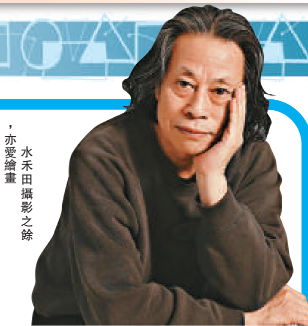
水禾田攝影之餘，亦愛繪畫