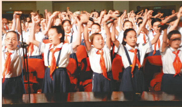
重慶舉行音樂詩誦會

點燃激情的節目最後一幕，《我們也有一面五星紅旗》在孩子們激昂整齊、鏗鏘有力的朗誦中，全場觀眾被這突如其來的一幕深深地震撼，音樂詩歌朗誦會伴隨著重慶市優秀學生代表《半城山水滿城橘》的童聲合唱謝幕。