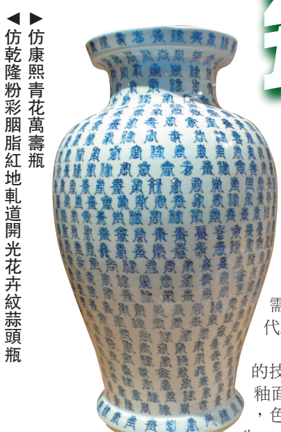
▲ 仿康熙青花萬壽瓶 ▲ 仿乾隆粉彩胭脂紅地軌道開光花卉紋蒜頭瓶

黃雲鵬所製「皇窰」，以青花、鬥彩為主；江訓清所製的「江窰」，則以製作粉彩和珐瑯彩為主。黃雲鵬表示：「仿古以『亂真』為最高標準，不論在釉料、胎質都要求最高的品質，亦要有高級的陶藝師傅和畫師參與，製作過程一絲不苟，需要經過多年的探索鑽研，反覆研究和實驗，才能製作出來。」