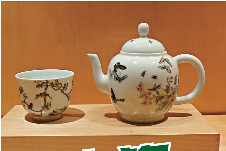
▲ 仿乾隆粉紅描金纏枝八寶雙耳瓶