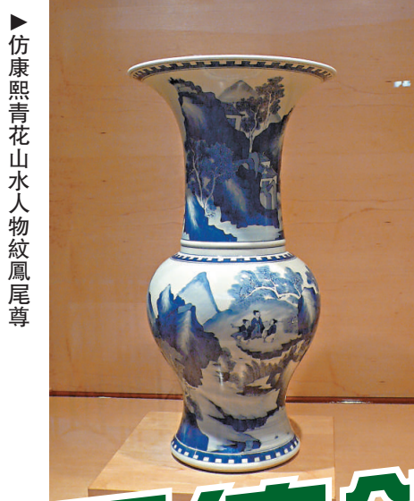
▲ 仿康熙青花山水人物紋鳳尾尊