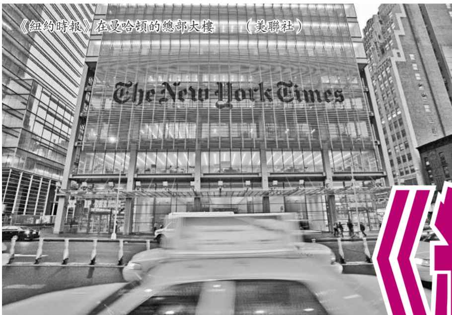
《紐約時報》在曼哈頓的總部大樓