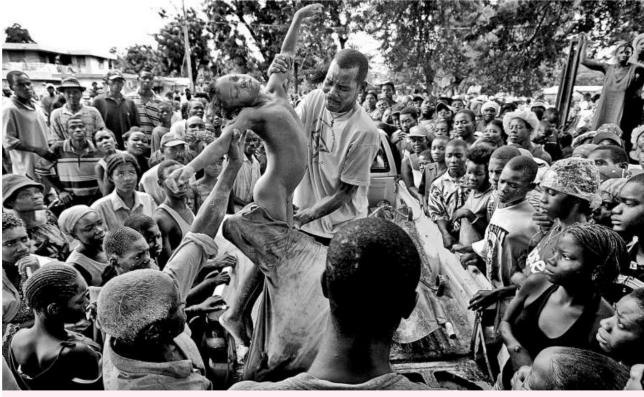
《邁阿密先驅報》獲突發新聞攝影獎的作品之一，海地洪災的遇難者

力——這類報道需要花費大量時間和大量篇幅來報道，這種新聞寫作已因新聞機構裁員和關閉各地辦事處而日益難以為繼。在星期一的普立茲獎得主中，至少有一人今年已遭解僱。