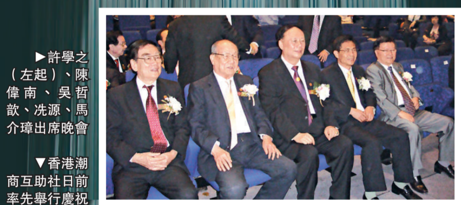
香港潮州互助社日前率先舉行慶祝國慶60周年遊藝晚會