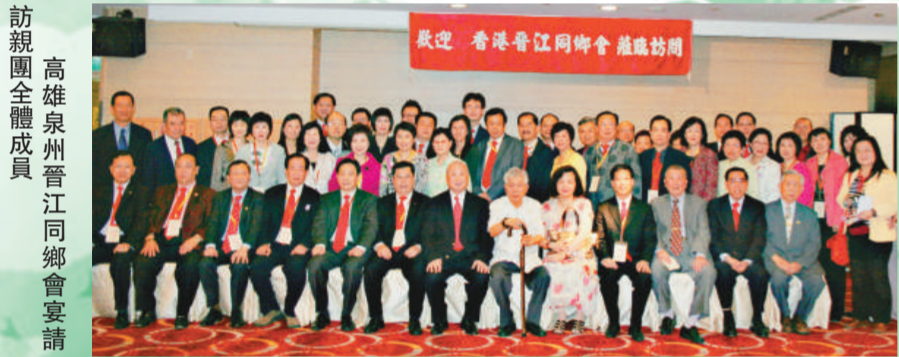
訪親團全體成員 高雄泉州晉江同鄉會宴請

第三天，不用一個鏡頭，高鐵就將訪親團全體成員由台中送到了台北。忠烈祠、淡水老街、漁人碼頭、101摩天大樓、士林夜市，大家樂此不疲，相機