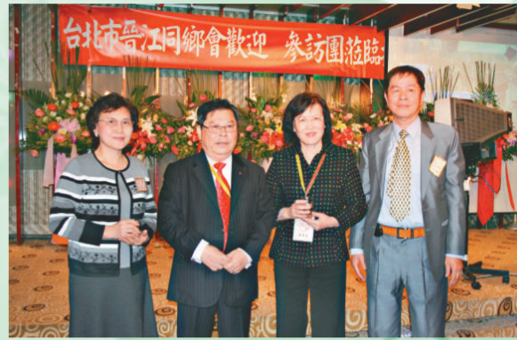
▼「世青會」的代表與台北市晉江同鄉會的領導合影