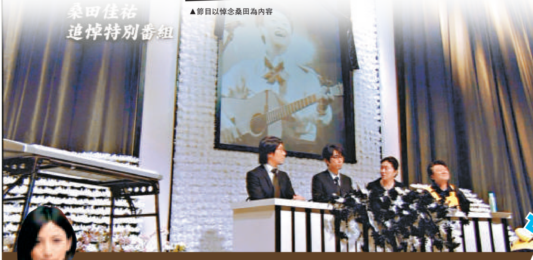
桑田佳祐 追悼特別番組