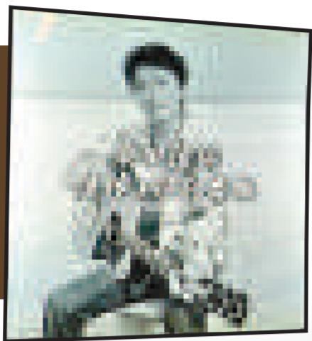
▲節目以悼念桑田為內容

自組合「Southern All Stars」暫休之後，「老頑童」主音桑田佳祐仍然甚活躍。他於本季為電視台主持音樂節目《桑田佳祐的音樂寅 MUSIC TIGER》，不過節目首集便先來一個惡作劇，但卻似乎玩得太過火，惹來觀眾的不滿。