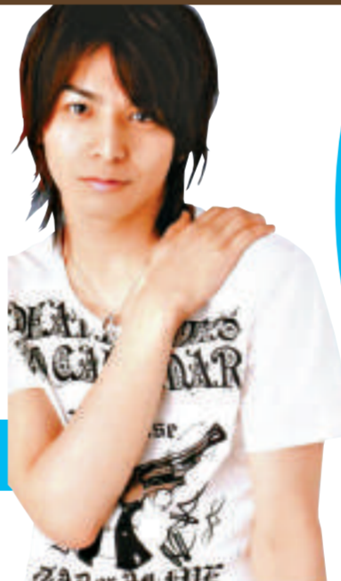
►生田為了新劇，曾多次到法庭旁聽