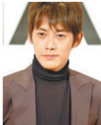
▲反町隆史宣布參演香取慎吾主演的《座頭市 The Last》

反町與香取於一九九五年合演過劇集《未成年》，相隔多年後再度碰面。這套終極版的《座頭市》會有新的劇情，香取演的座頭市，為了太太而不再斬殺他人，並回到故鄉的農村居住，反町便是座頭市的一名農民老朋友柳町。反町讀香取版的座頭市充滿新鮮感，兩人合作必定能擦出火花。至於演座頭市的太太多福一角，則由石原聰美擔任，她說多福打從心底愛着座頭市，所以在拍攝現場時，即使看不到香取，也會經常記掛着對方，十分投入。除了三人之外，演員名單中還有倍賞千惠子、工藤夕貴、寺島進、高岡蒼甫與豐功補等，陣容強勁，據知早前一名法國影評人曾到山形採訪電影的拍攝進度，表示電影在歐洲該有市場，而電影亦會以明年的康城影展為目標。