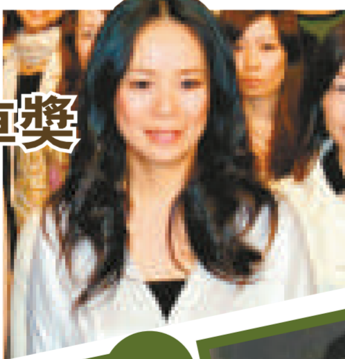
▲女星清水由貴子因為照顧母親以至心力交瘁，於父親的墓前自殺 ▲河瀨直美過往三度進軍康城，今年則成為金馬車獎的得主，以表揚她對電影界的貢獻

影壇盛事康城影展將於下月舉行，大會日前公布，將向日本的女導演河瀨直美頒發金馬車獎。同獎項在二〇〇二年由法國電影導演協會主辦，為表揚對電影有貢獻的導演而設。河瀨於一九九七年憑出道作《暗戀家族》奪得康城的新人導演獎，二〇〇三年時又有《沙羅雙樹》競逐大獎，到二〇〇七年時《殯之森》更得到評審團大獎。頒獎儀式會於下月十四的導演周開幕儀式上舉行。