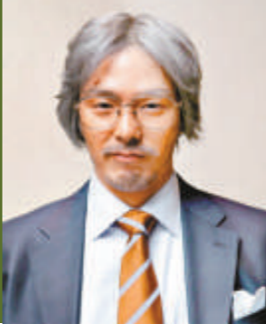
▲朴龍河在新劇《男人故事》中的老妝