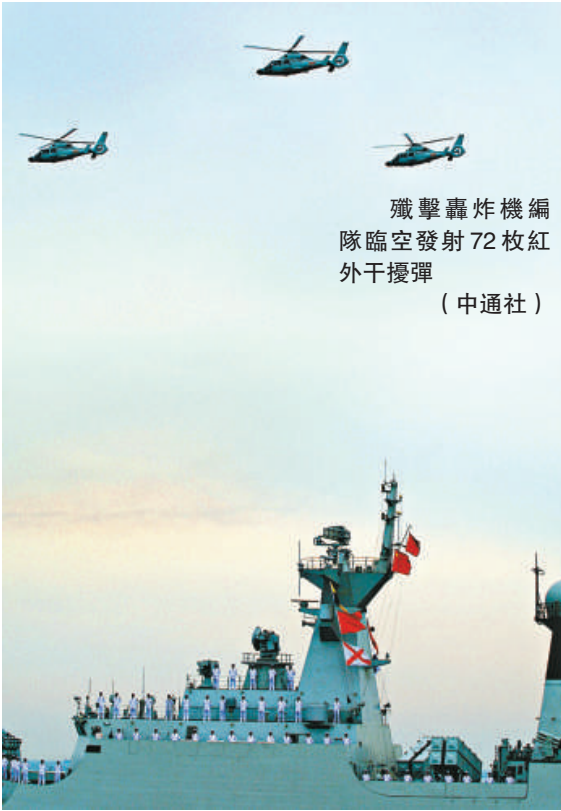
殲擊轟炸機編隊臨空發射72枚紅外干擾彈

15時10分，閱兵艦緩緩駛過墨西哥海軍「誇烏特莫克」號風帆訓練艦向閱兵艦致敬後，一場激盪心靈的海上盛大閱兵式完美落幕。