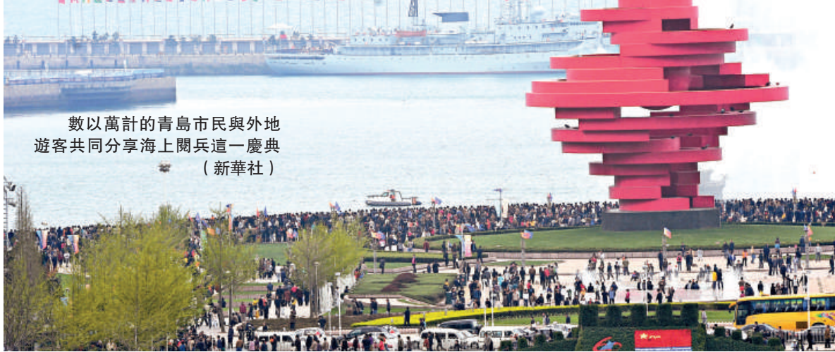
數以萬計的青島市民與外地遊客共同分享海上閱兵這一慶典

贏得世界尊重的中國海軍，通過多國海軍活動收穫了跨越大洋的友誼。墨西哥「誇烏特莫克」號風帆訓練艦以三百年前古老的方式日夜兼程來到青島，水兵勇敢地站在桅杆上，體現出搏擊大海的自信。共有21名官兵的澳洲海軍「阿米代爾」級的「佩里」號巡邏艇接受檢閱，是澳洲目前主要的近海防禦兵力，難