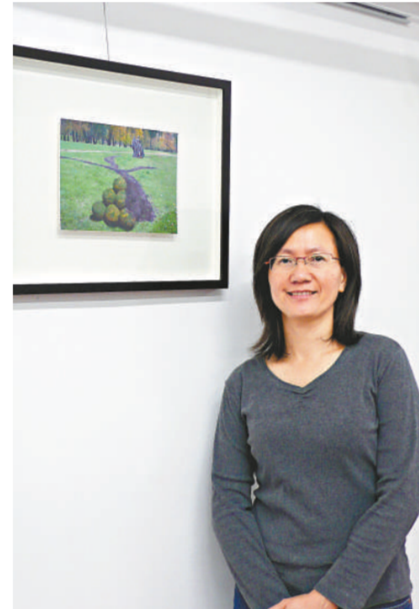
盧婉雯展出攝影作品