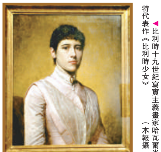
比利時十九世紀寫實主義畫家哈瓦爾特代表作《比利時少女》