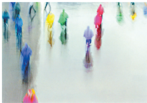
黃貴權《雨日》中，灰暗街角點綴着數點雨衣的鮮艷色彩

「光影神韻——攝影大師陳復禮、簡慶福、黃貴權」主要透過三位前輩攝影家百多幅作品，介紹一九五〇至八〇年代香港獨特的畫意攝影藝術。這三十年間可說是畫意攝影的天下。當時香港中西文化兼容並蓄，攝影家既受西方攝影風格的影響，亦追求在攝影中表現繪畫的意境，更深受中國傳統文化的熏陶，從而建立了獨特的攝影風格。其中活躍至今的中堅分子當數展覽中的三位名家，他們在國內外均享