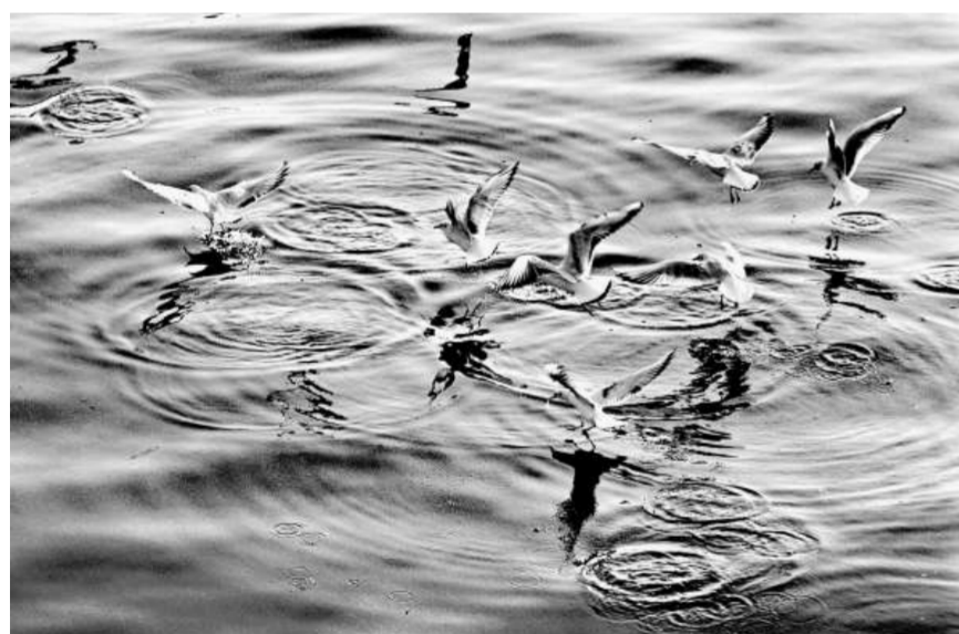
沙龍中曾獲獎六十餘次以上，堪稱紀錄