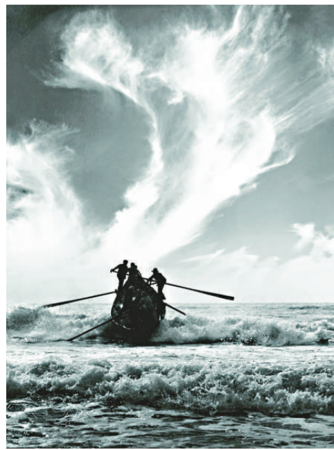
陳復禮於一九五〇至一九六〇年代的其中一幅代表作品《搏鬥》

，文化博物館於今年起推出「香港攝影系列」展覽，除介紹香港的攝影藝術，更逐步透過不同的專題性展覽，展出具有代表性的攝影家的作品，藉此整理及展望香港攝影藝術的歷史與發展。