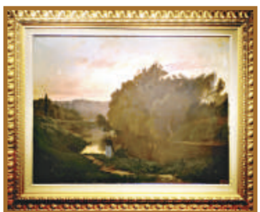
法國印象派繪畫大師弗朗索瓦·弗朗索瓦·德易斯經典名作《黃昏》

「觸摸經典——歐洲18至19世紀古畫展」正在天津六號院藝術區舉行，展出來自俄羅斯、法國、比利時、荷蘭等繪畫藝術發達國家的經典藝術作品。