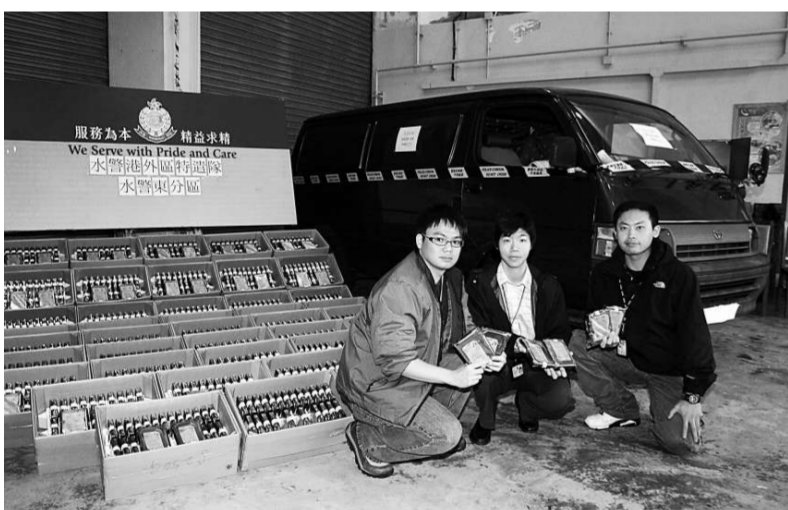
水警在西貢南圍海邊偵破走私案，檢獲一千三百件電腦硬碟

他表示，在被綁架期間，自己和黃世榮皆曾遭受毆打酷刑，不過他承認只是皮外瘀傷，傷勢目前已痊癒。至於他會提及綁匪持有的電槍，亦沒有用來施刑；被禁錮日子「最慘」的經歷，也只是最初兩天沒飯吃，以及大小二便用放在身邊的垃圾筒解決。