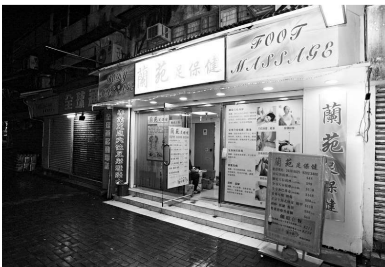
遇劫足浴店位於大埔大明里二十九號一個舖位

一名駐守羅湖警崗的休班警（二十三歲）經過附近，聞言上前查看，發現劫匪向廣福道逃跑，立即從後窮追，此時，大埔警署特遣隊三名警員亦接報加入追捕，經過逾百米追逐，終於在大明里附近擒獲一匪，並在附近垃圾桶內，檢獲一把懷疑涉案利刀，遂將疑犯連同證物帶返警署，其他賊人則逃去無蹤，案中無人受傷。