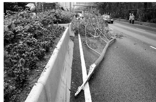
兩米長樹幹倒塌，橫臥馬路

【本報訊】鑽石山荷里活廣場對開龍翔道，昨晨十一時許發生塌樹意外，龍翔道往觀塘方向路邊花園的一棵十五米高大樹，中間突然折斷，約兩米長樹幹突然倒塌，橫臥三線馬路；消防員到場將樹幹搬走，現場很快恢復通車，交通未受影響。