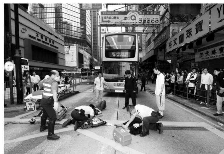
兩名內地女子被撞倒後，救護員到場為傷者止血

另外，一隻小花貓昨午一時半闖進鯉魚門廣場，疑頑皮貪玩走進扶手電梯，結果被困於扶手電梯頂部，兩隻前爪被夾傷流血，傷口更深及見骨，街坊發現報警，消防員趕到救出花貓，再交由到場的愛護動物協會人員包紮傷口，然後帶走安排進一步治理。