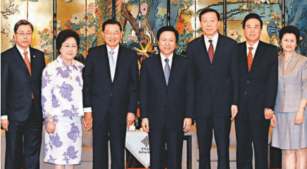
江蘇省領導二十七日會見並宴請江丙坤一行。海協會會長陳雲林（左六）、江蘇省委書記梁保華（左四）、省長羅志軍（左五）與台灣海基會董事長江丙坤（左三）、副董事長兼秘書長高孔康（左一）等在會後合影（新華社）

【本報記者賀鵬飛南京二十七日電】中共江蘇省委書記梁保華、省長羅志軍二十七日中午在南京金陵飯店會見並宴請海基會董事長江丙坤一行。梁保華在會見時表示，江蘇省將協助台資企業拓展大陸內銷市場，並支持江蘇有實力的企業到台灣投資。