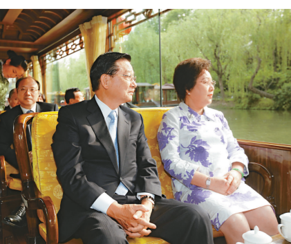
江丙坤夫婦二十七日遊覽西湖。當日，由台灣海基會董事長江丙坤率領的海基會協商代表團在揚州瘦西湖參觀遊覽

另訊，台媒二十七日報導，兩岸規模最大、大陸動員企業負責人層次最高的「兩岸企業家高峰論壇」，將於五月三日至五日在台北展開，邀請二百位大陸零售、房產、餐飲界企業家赴台交流。