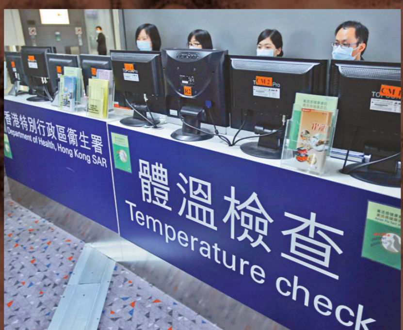
▲當局在機場布陣監測旅客體溫

【本報訊】繼○三年沙士後，本港再面臨另一場世紀大疫症挑戰。衛生防護中心昨日證實，三宗疑似新型豬流感個案，兩宗最初證實為虛驚一場，餘下一宗進一步化驗後，亦證實無事。為加強防疫，政府推出新措施，包括將人類感染豬流感列入法定呈報疾病，衛生署每日在網上公布最新消息，以及擴大旅客體溫測試。政府呼籲市民毋須過分恐慌，以及避免前往受影響地區。