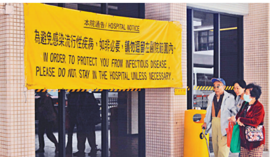
▲醫院對探病者提警告勿逗留太久

食物及衛生局副局長梁卓偉透露，昨早各衛生部門開會分析全球新型豬流感情況，局長周一嶽昨午亦與世衛總幹事陳馮富珍通電話，了解最新進展，雙方交換資訊。他說，世衛昨晚將開會討論豬流