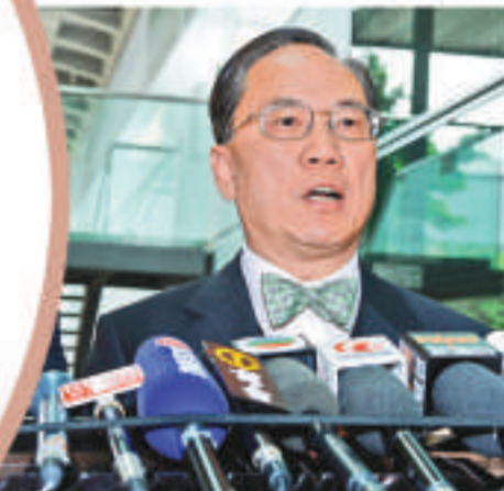
▲曾蔭權稱每日都會檢視情況

【本報訊】豬流感隨時襲港，引起全城關注。行政長官曾蔭權昨日強調，政府已經高度戒備豬流感的爆發，全力應付這次流感可能襲港的風險。至於會否因應墨西哥的情況發出旅遊警告，他表示，本港每日都會檢視情況，有需要時候會做。