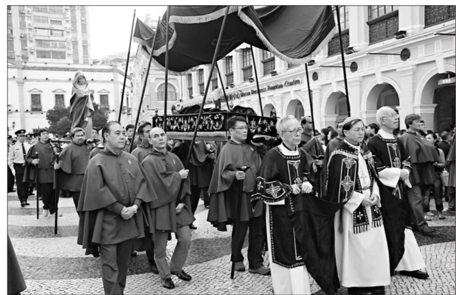
澳門天主教徒抬着聖屍和聖母像行經議事亭前地