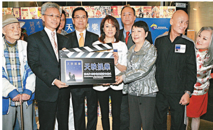
天映娛樂有限公司捐贈邵氏片庫珍藏予香港電影資料館，多位影視界名人出席移交儀式

【本報訊】記者鍾麗明報導：《江山美人》、《七十二家房客》、《貂蟬》、《大軍閥》、《獨臂刀》等珍貴的邵氏公司電影拷貝，將永久「落戶」香港電影資料館，令這些屬於港人集體回憶的經典電影，可讓大眾重溫之餘，也讓下一代有機會認識。