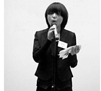
馬然代表獲獎學生致辭時表示，多謝家人的支持，未來將繼續自己熱衷的電影研究