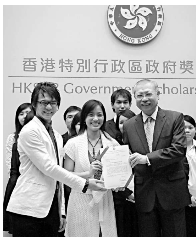
孫明揚為各院校代表頒發獎學金

【本報訊】記者孟苑報導：施政報告撥款十億設信託基金，向傑出學生提供獎學金，將香港發展為區域教育樞紐。政府於本學年從該基金中分撥約一千二百萬元作為獎學金予九所本港院校。昨日政府舉行首屆「香港特別行政區政府獎學金」頒獎禮，二百三十名學生同獲頒授，教育局局長孫明揚表示，特區政府獎學金基金將於下學年增加一倍至約二千四百萬元。