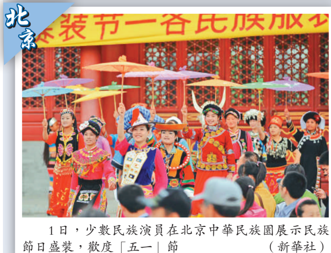
1日，少數民族演員在北京中華民族園展示民族節日盛裝，歡度「五一」節