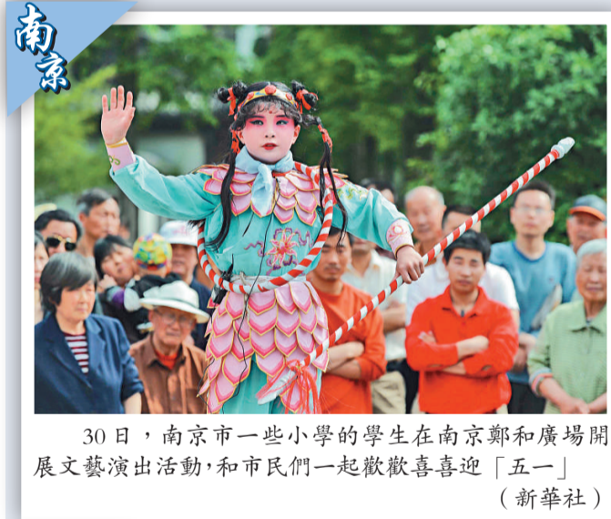
30日，南京市一些小學的學生在南京鄭和廣場開展文藝演出活動，和市民們一起歡歡喜喜「五一」