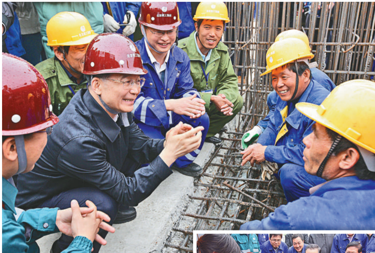
▲溫家寶在地鐵建設工地與工人們親切交談 ▶溫家寶在地鐵建設工地食堂門口與工人一起摘菜

困難的一年。我們遭受了百年罕見的國際金融危機的嚴重衝擊，最近一些國家又發生了甲型流感疫情，也會對中國經濟社會發展帶來影響。但是我們相信，只要堅定信心，迎難而上，有黨和政府的堅強領導，有正確的方針、政策和措施，有全國人民的團結奮鬥，有工人、技術人員和幹部的創造性工作和勞動，就一定能夠戰勝任何困難。