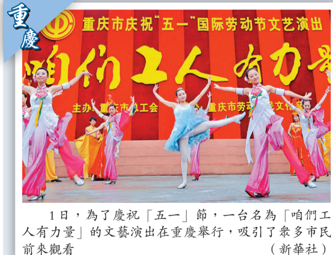
1日，為了慶祝「五一」節，一台名為「咱們工人有力量」的文藝演出在重慶舉行，吸引了眾多市民前來觀看